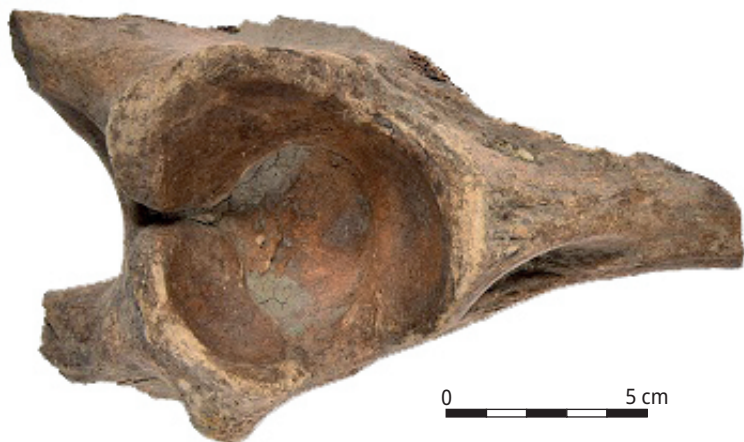
Ryc. 4. Fragment panewki kości miednicznej żubra ze śladami rąbania na trzonach kości biodrowej, łonowej i kulszowej.