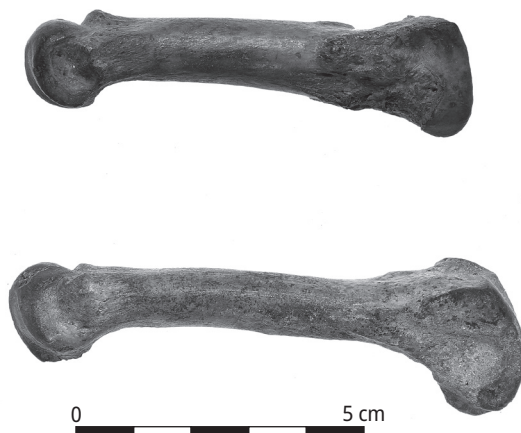
Ryc. 6. Kości odcinka metapodialnego niedźwiedzia.