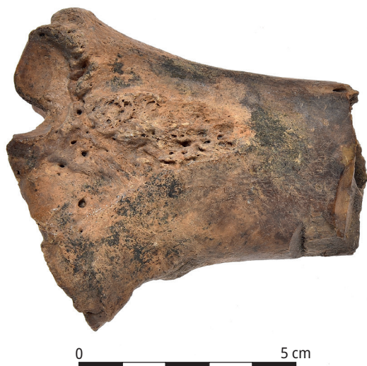
Ryc. 3. Fragment nasady bliższej i trzonu kości promieniowej jelenia (strona doogonowa) ze śladami rąbania w poprzek trzonu.