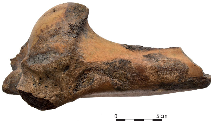
Ryc. 5. Fragment nasady bliższej i trzonu kości ramiennej żubra ze śladami rąbania w poprzek trzonu i ogryzania przez psy na guzku.