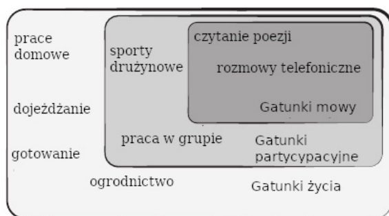
Rys. 2. Gatunki praktyk życiowych. Tłum. własne, ilustracja za di Paolo, Cuffari, de Jaegher 2018, s. 179.