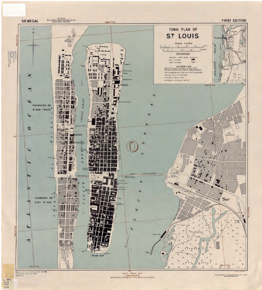
Fot. 4. Plan Saint-Louis z 1942 roku.