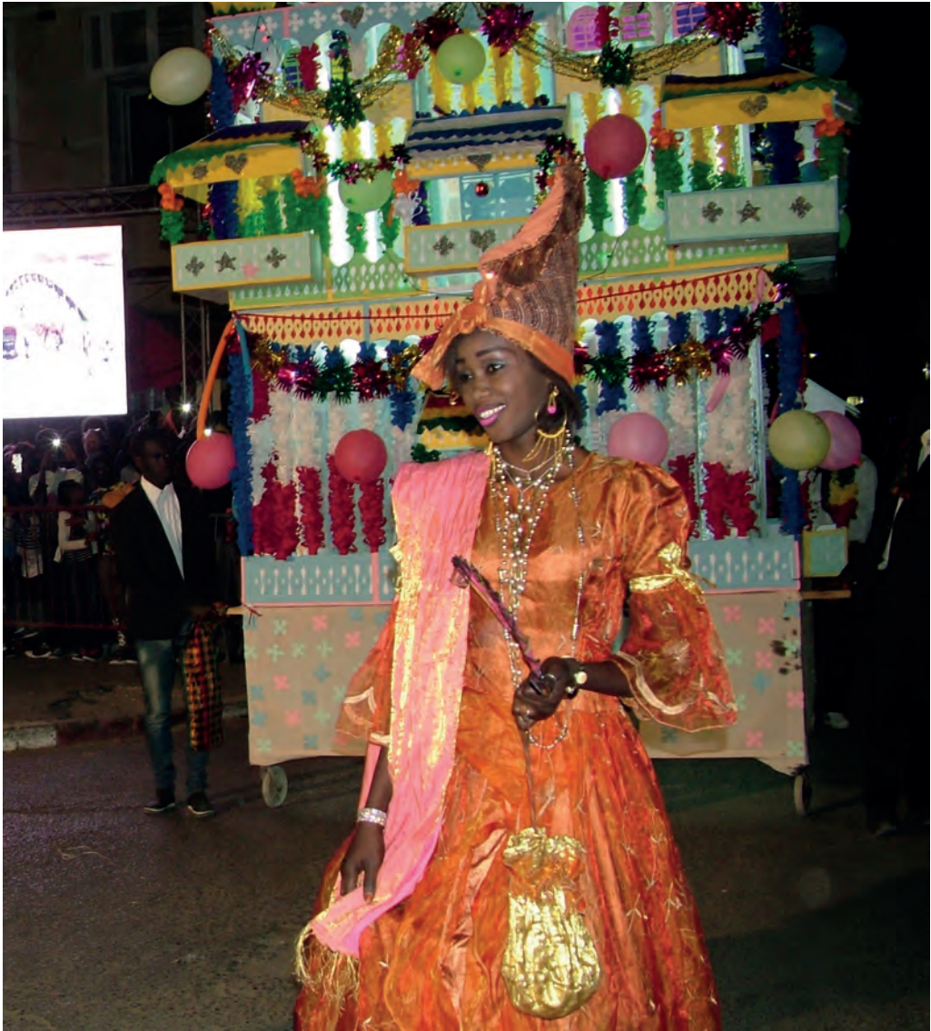
Fot. 8. Mieszkancki Saint-Louis chętnie paradyją w tradycyjnym stroju signares podczas ulicznej parady – Fanal .

XX wieku. Wraz dekolonizacją Senegalu, Saint-Louis stało się jednym z kilku prowincjonalnych miast tego kraju, którego mieszkańcy musieli na nowo zbudować swą afrykańską, senegalską tożsamość 50 . W wymiarze symbolicznym afrykanizacja Saint-Louis