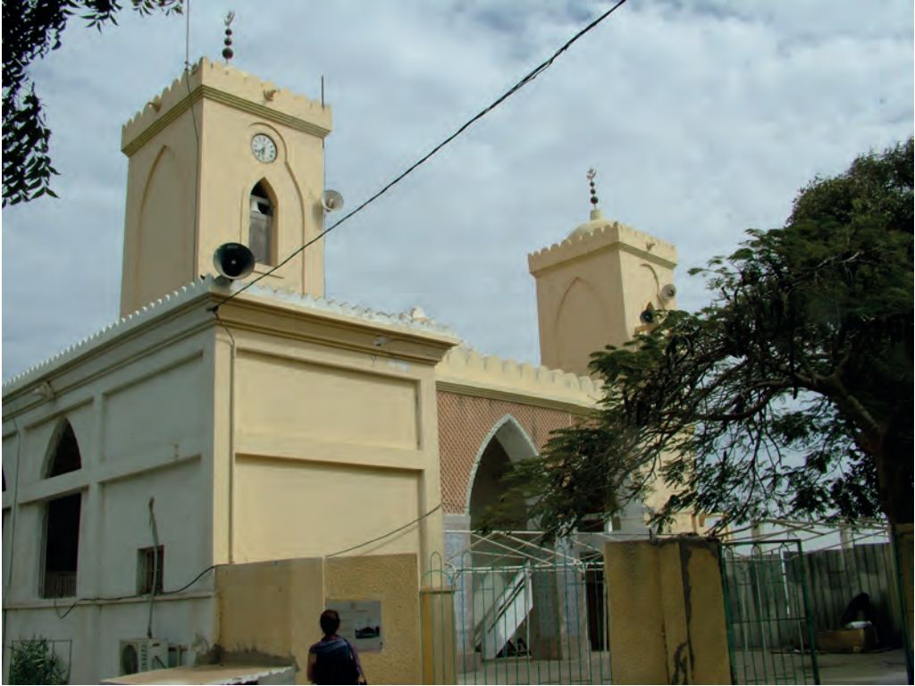
Fot. 6. Grande Mosque. Na lewym minarecie widoczny zegar i dzwon.