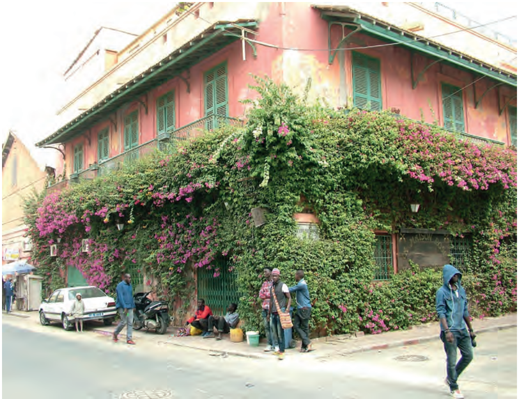
Fot. 7. Domy typu "Bourdeux".

dygnacje budynków położonych przy głównych ulicach (biegnących na osi północ-południe) przeznaczone są na cele handlowe lub biurowe. Przy tych ulicach, w starych budynkach, ulokowanych jest kilka dobrej klasy hoteli (skromniejsze hotele odnaleźć można także przy bocznych uliczkach). Budynki przy nabrzeżach, niegdyś pełniące funkcje magazynów portowych, służą obecnie jako hurtownie lub dyskonty bądź stoją opustoszałe. Co bardziej okazałe budynki kryją prawdziwe rezydencje, z patiami i ogrodami. Miejsce nadrzecznych bulwarów zajmuje w dużej części port rybacki.