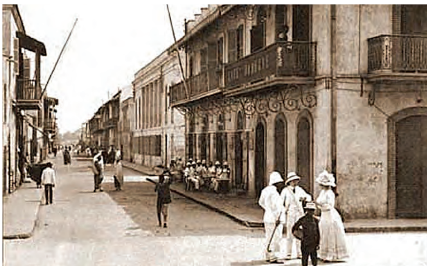
Fot. 2. Centrum Saitn-Louis, rue Lebon (ok. 1900) [Domena publiczna]

Źródło: https://upload.wikimedia.org/wikipedia/commons/1/17/Colonial_Saint_Louis.jpg