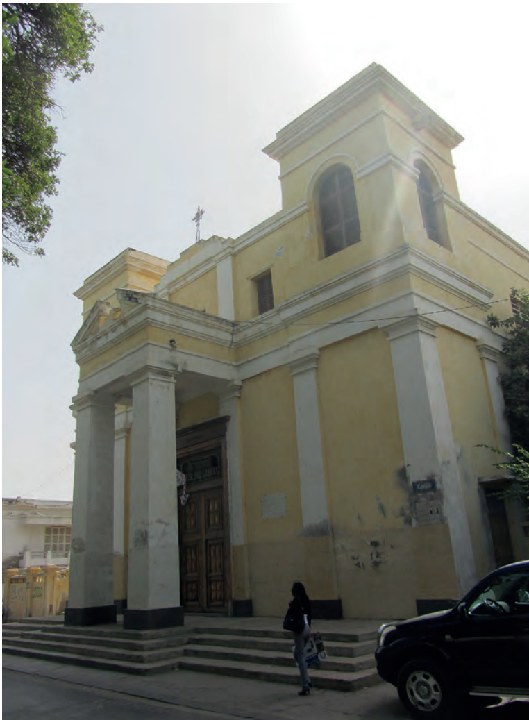
Fot. 5. Katedra w Saint-Louis pod wezwaniem Świętego Ludwika.