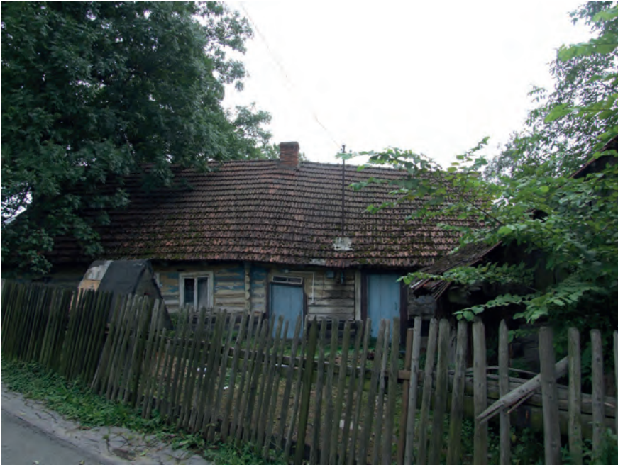
K – Mogiła, ul. Powiatowa 12, Fot. Tobiasz Orzeł (2019)