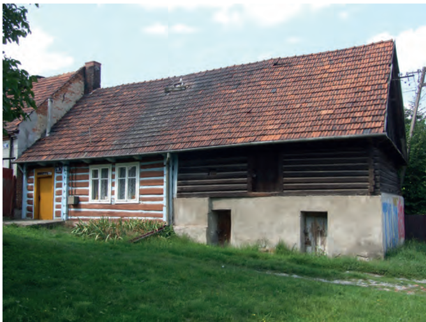
O – Bronowice Wielkie, ul. Budrysów 15 (2019)