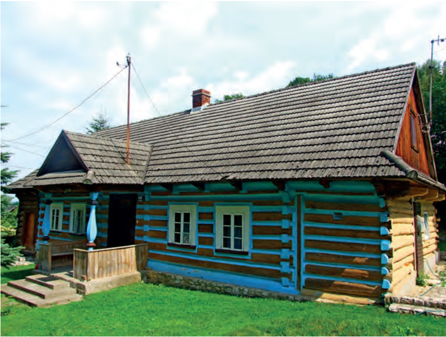
G – Tynec, ul. Benedyktyńska 42, Fot. Tobiasz Orzeł (2019)