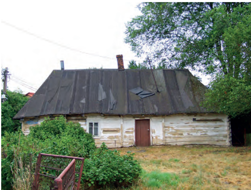
J – Krzesławice, ul. Wańkowicza 81, Fot. Tobiasz Orzeł (2019)