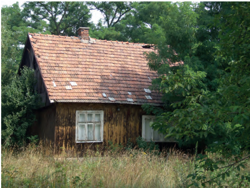
E – Wróblowice, ul. Niewodniczańskiego 11, Fot. Tobiasz Orzeł (2019)