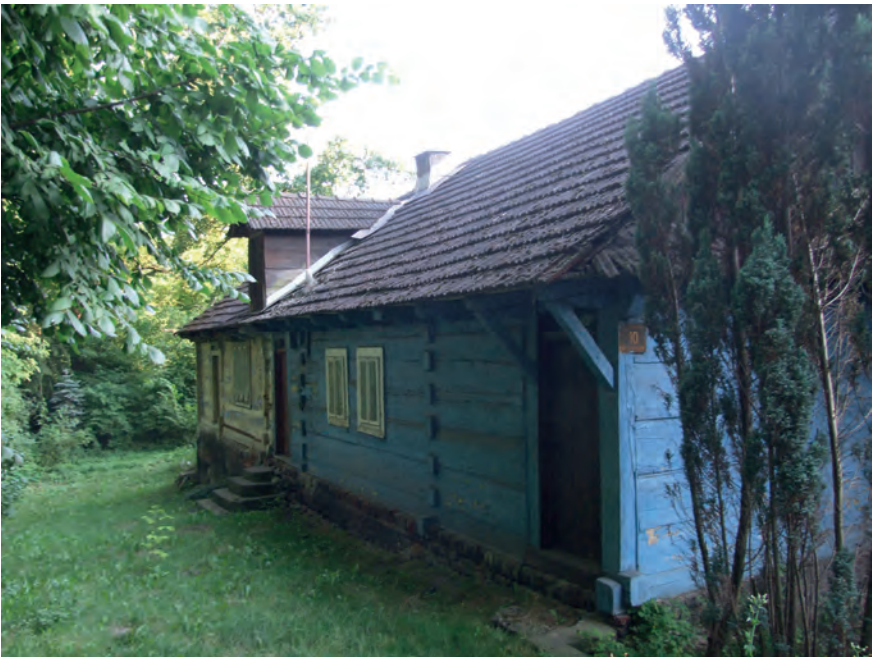
D – Pleszów, ul. Jezierskiego 10 (2019)