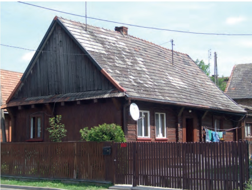
H – Olszanica, ul. Majówny 40 (2019)