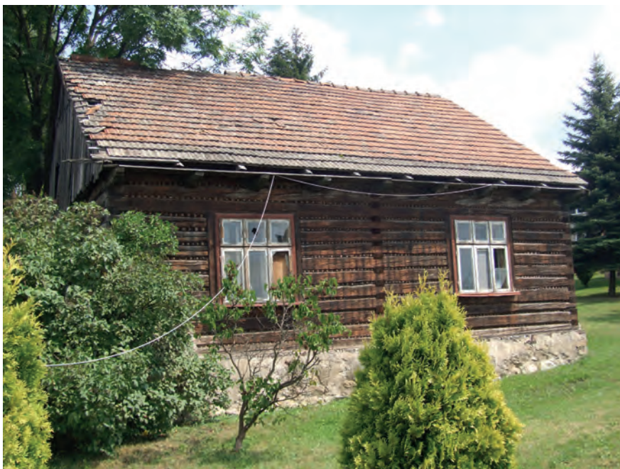
F – Skotniki, ul. Skotnicka 207, Fot. Tobiasz Orzeł (2019)