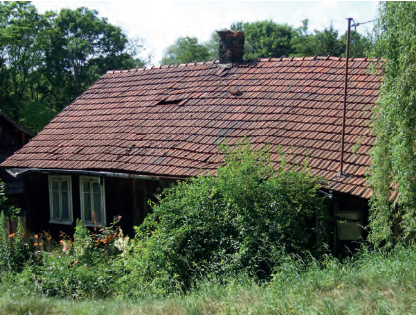
A – Witkowice, ul. Koralkowa 13, Fot. Tobiasz Orzeł (2019)