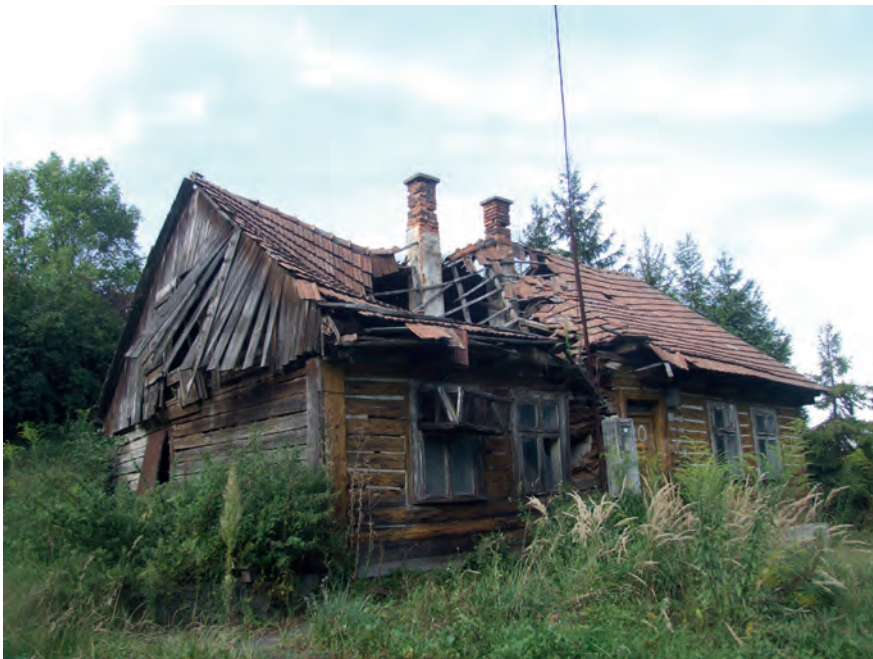
N – Chełm, ul. Przyszłości 20 (2019)