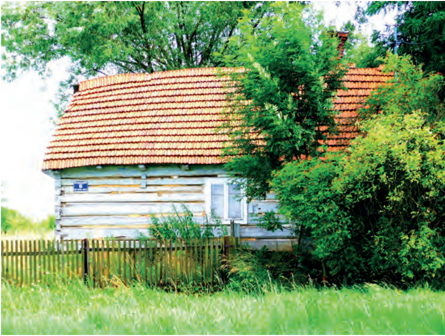
C – Wolica, ul. Biwakowa 6