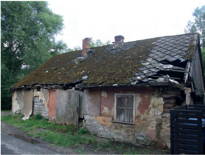
M – Piaski Wielkie, ul. Mokra 26 (2019)