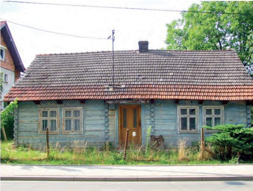
B – Lubocza, ul. Lubocka 17, Fot. Tobiasz Orzeł (2019)