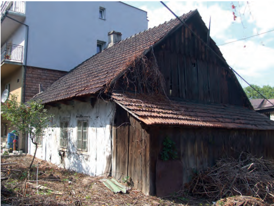
L – Bieżanów, ul. Bieżanowska 219A, Fot. Tobiasz Orzeł (2019)