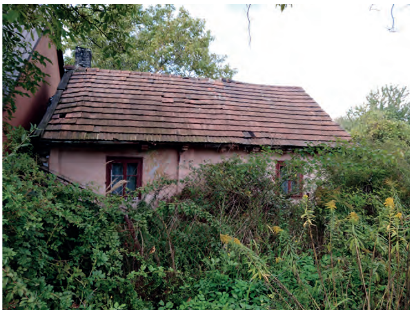
P – Ludwinów, ul. Rozdroże 10A, Fot. Tobiasz Orzeł (2019)