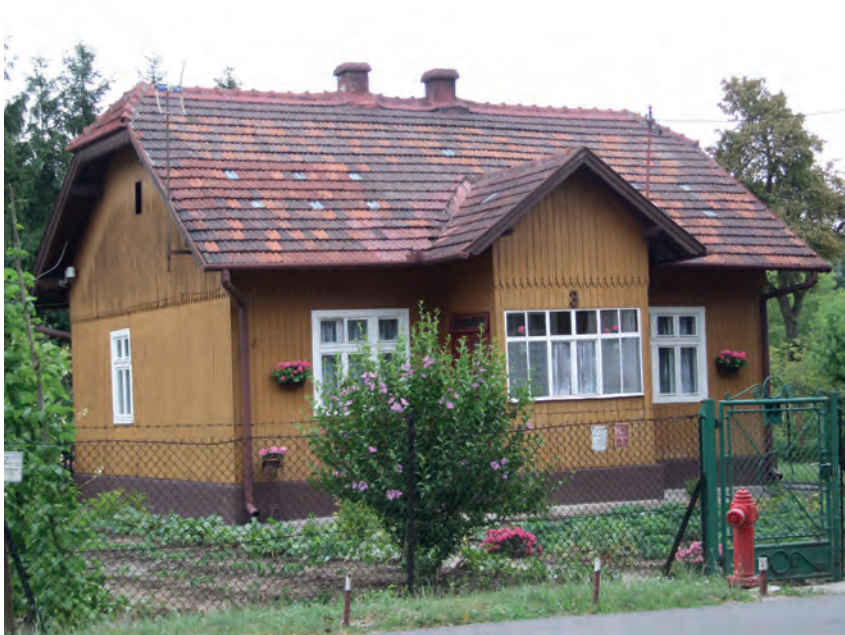
I – Bieńczyce, ul. Stadionowa 3, Fot. Tobiasz Orzeł (2019)