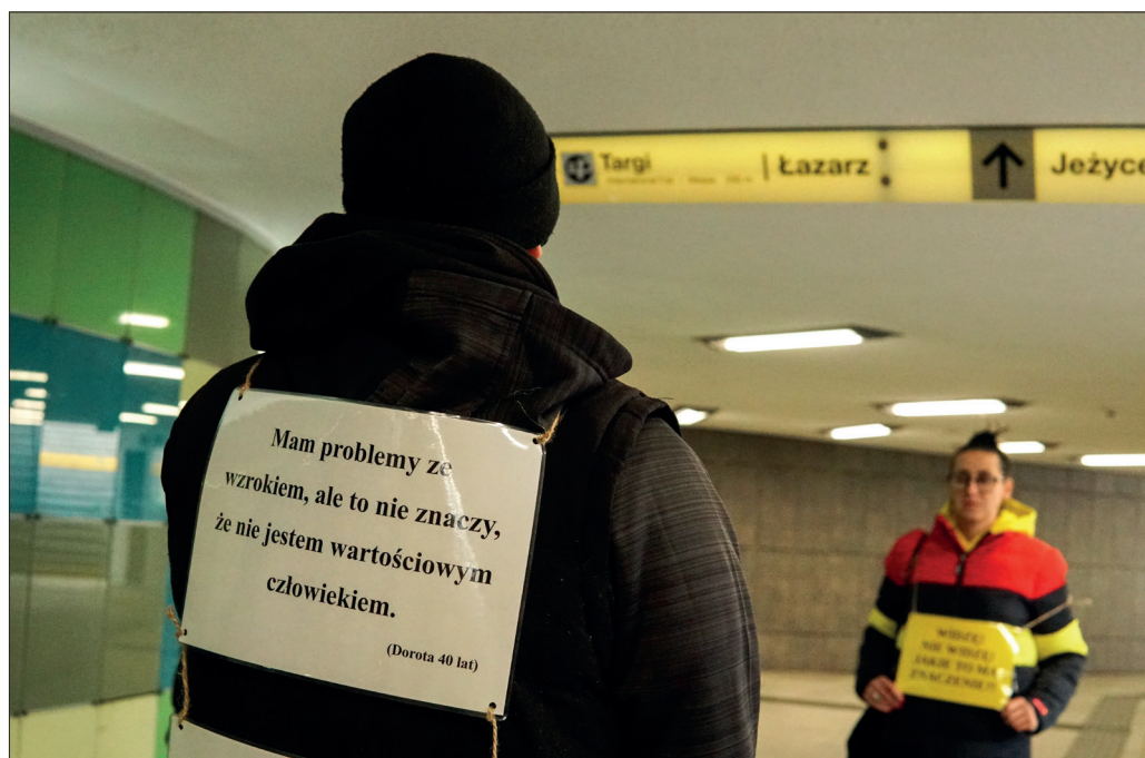
Fot. 3 Poznań, rondo Kaponiera, fot. S. Kowańska.

aby ukazywało zorientowanie etnografii na przyszłość. Autorzy projektu, wczuwając się w potrzeby odbiorców oraz starając się zrozumieć specyfikę języka migowego, uzyskali nie tylko znak w PJM określający „muzeum etnograficzne”, ale również zbudowali zaangażowanie odbiorców i promowali wydarzenia dostępne w muzeum, opowiedzieli też, czym jest dyscyplina nazywana etnografią.