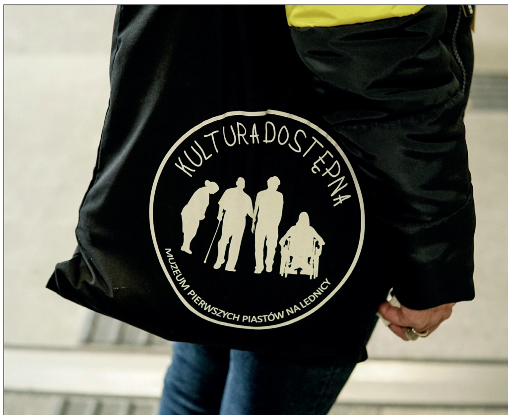
Fot. 1 Poznań, rondo Kaponiera, fot. S. Kowańska.

Wiele instytucji kultury zмага się z problemem frekwencji podczas organizowanych przez nich wydarzeń ukierunkowanych na środowiska osób z niepełnosprawnościami. Z podobnym kłopotem mierzyło się Muzeum Etnograficzne im. Seweryna Udzieli w Krakowie. Mimo że muzeum to od lat stara się wykonywać działania