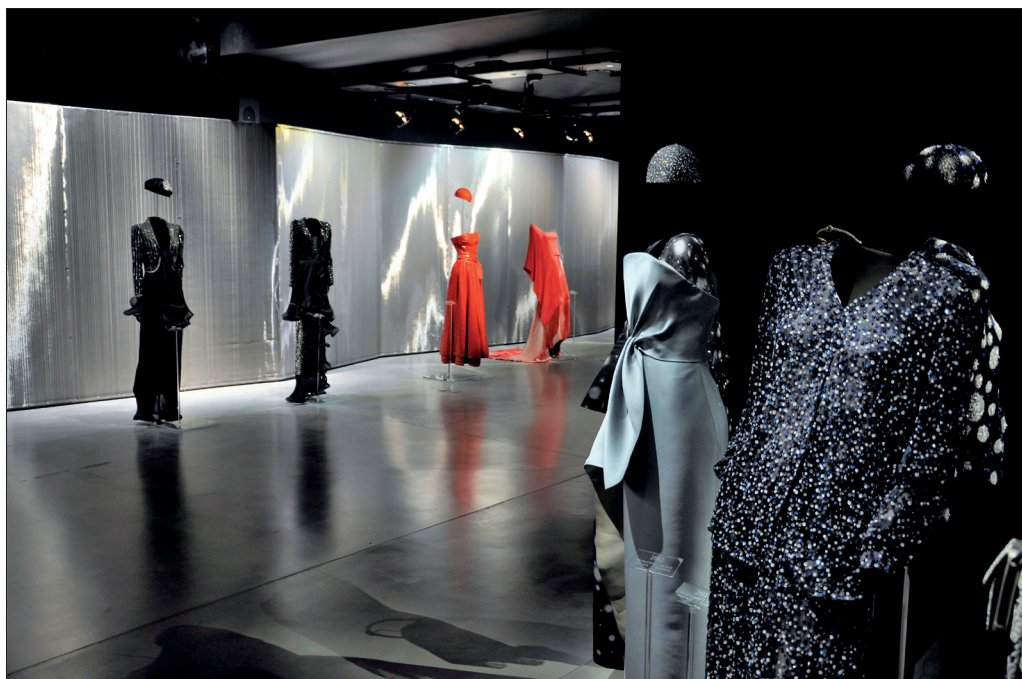
Il. 5. Kolekcja mody w Armani Silos

i wynalazcom 2 . Środki finansowe, którymi dysponują powodują, że mogą stać się mecenasami sztuki, gromadzić wybitne kolekcje i wznosić imponujące gmachy muzealne. W przeciwieństwie do XIX-wiecznych kolekcjonerów, którzy dla zachowania swoich zbiorów tworzyli muzea pod własnym nazwiskiem (Frick, Barnes, Stewart Gardner, Guggenheim, Getty etc.), muzea tworzone obecnie przez właścicieli największych domów mody noszą nazwy słynnych modowych marek: Armani, Cartier, Vuitton, Prada. Jest to zabieg o stricte marketingowym charakterze (Codignola, Rancati 2016: 50–69).