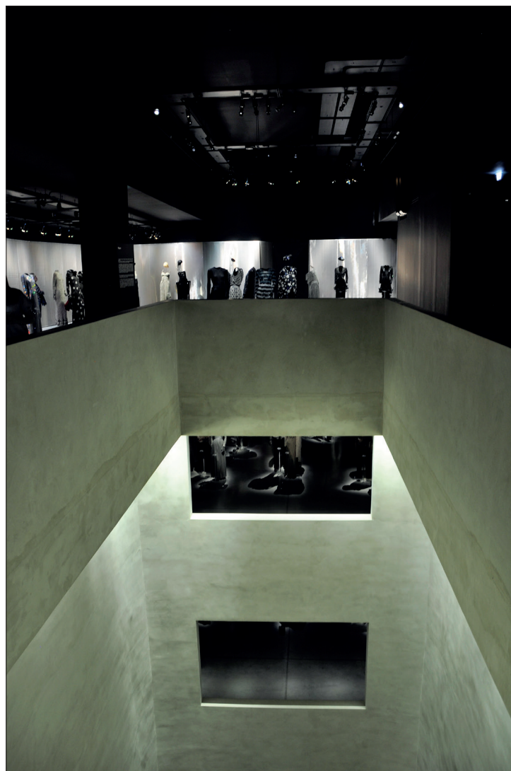
Il. 4. Wnętrze Armani Silos, fot. autor.

W epoce medialnego spektaklu muzeum stało się nośnym medium, które z jednej strony nobilituje, a z drugiej upowszechnia i wzmacnia daną markę. Obserwujemy charakterystyczne sprzężenie zwrotne – nowe muzea mody podnoszą modę do rangi sztuki, wielcy krawcy stają się artystami, a elementy ubioru, płaszcze, sukienki i buty, zamieniają się w dzieła sztuki (il. 5). Dzięki temu ceny tych budzących pożądanie przedmiotów mogą być podnoszone do niewyobrażalnych uprzednio poziomów, a właściciele domów mody budują fortuny, dorównujące najbogatszym na świecie przemysłowcom