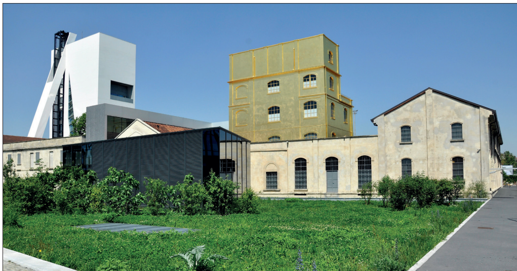
Il. 3. Fondazione Prada: od lewej Torre, Cinema, Haunet House i Bar Luce, fot. autor.

zwykle niewidocznych systemów instalacyjnych i detali konstrukcyjnych architektura Koolhaasa „wydobywa nowe znaczenia z prozaicznych budowli, znanych nam z codziennego życia” (Betsky 2018). Obiekt zyskał uznanie, otrzymał prestiżową nagrodę Compasso d’Oro, którą wyróżnia się wybitne prace projektowe powstałe na gruncie włoskim (Guernieri 2018).