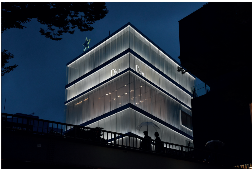
Il. 1.. Butik firmy Dior przy Omotesando w Tokio, SANAA 2004, fot autor.

całkowicie przejrzysta, a w lecie, gdy otwierane są przesuwne skrzydła, praktycznie znika, jej przestrzeń staje się przedłużeniem ulicy i ogrodu. W ten sposób architektura dematerializuje się, staje się transparentnym, wręcz eterycznym tłem dla pokazów, wystaw i innych aktywności, które mają miejsce w budynku i jego bezpośrednim otoczeniu (Berbesz 2011: 31). Fundacja Cartiera stała się prekursorem trendu budowy muzeów sztuki współczesnej przez fundacje wielkich domów mody.