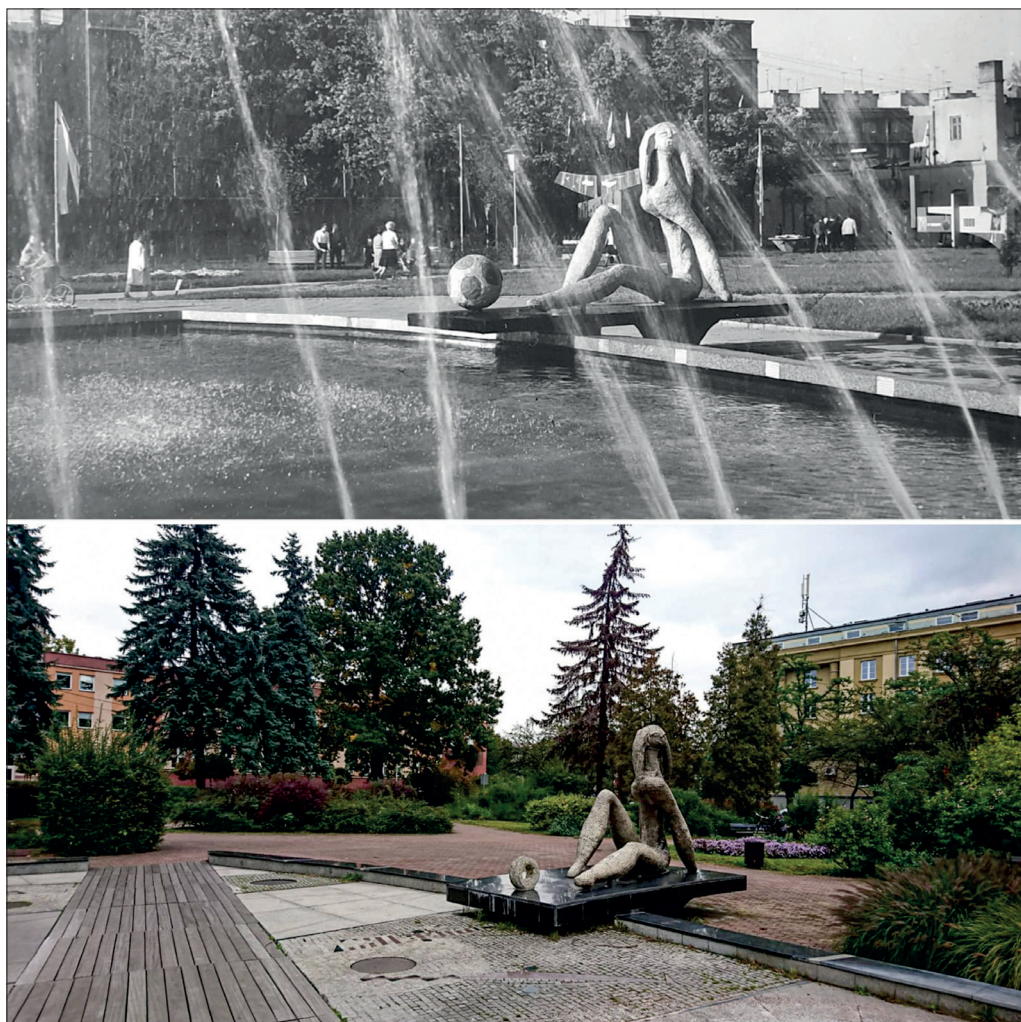
Il.3. Fontanna „Pani Kowalska” projektu Włodzimierza Ściegiennego w 1964 r. i w 2019 r..