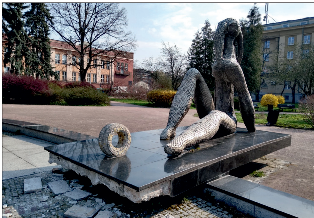
Il.5. Zniszczona fontanna „Pani Kowalska” w 2021, źródło: https://gazetaregionalna.com/pani-kowalska-sie-sypie-alarmuje-radna/ , dostęp: 10.12.2021.

I niech się rozsypie ta ohydna rzeźba i niech już nie straszy. A może po prostu czas aby zmienić to szkaradztwo. Wiem, że dla wielu ten pomnik to dużo wspomnień ale czas idzie do przodu i można by było postawić coś ładniejszego trzeba zrobić referendum Częstochowian 23 .