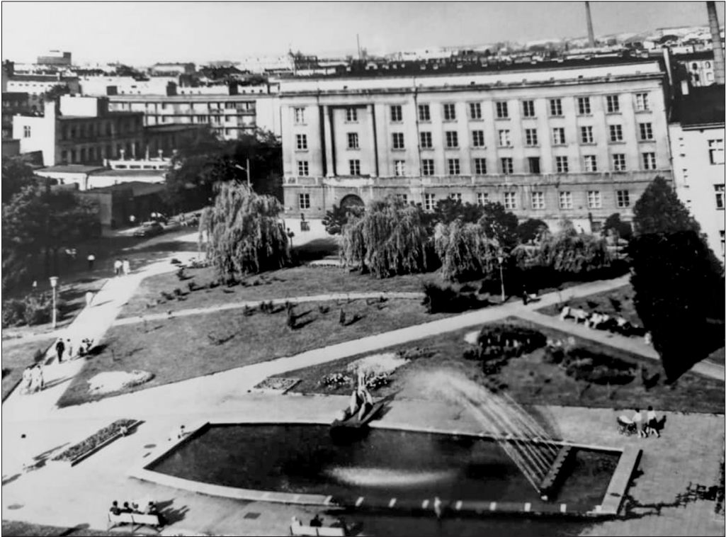
Il. 1. Fotografia pokazująca skwer ze zrealizowaną fontanną autorstwa Włodzimierza Ściegiennego z 1964 roku.

dno fontanny (pomagała mu w tym, jak zawsze, żona – Karolina Ściegienny). Szablony z ułożoną mozaiką służyły następnie do przełożenia i zatopienia wzoru w ostatecznym podłożu.