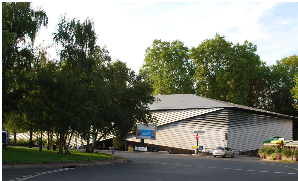
Fot. 1. Paryż, Muzeum Alberta Kahna, widok od południa. Fot. B. Stec 2022