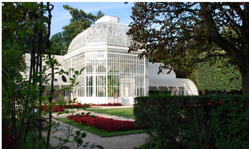
Fot. 4. Paryż, Muzeum Alberta Kahna, fragment ogrodu francuskiego ze szklarnią po adaptacji K. Kuma.

warstwa między wnętrzem a otoczeniem budowli, muzeum a miastem. W sensie metaforycznym engawę w Muzeum Kahna można odczytać jako obszar graniczny między kulturami. Kuma rozwija typ miejskiego muzeum- engawy jako całości architektoniczno-przyrodniczej o funkcji edukacji, zarówno przez intelektualne poznanie ekspozycji, jak i jej kontemplowanie.