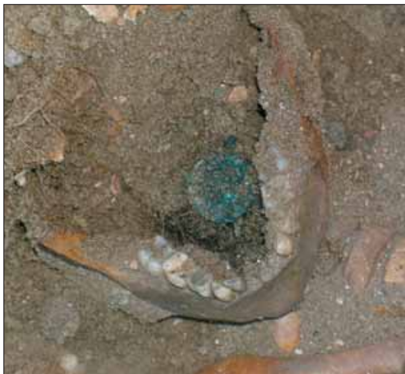
Ryc. 9. Pień, woj. kujawsko-pomorskie, stan. 9 (cmentarzysko). Moneta w grobie 5 (in situ)

Na podstawie dotychczasowych studiów nad interesującą nas problematyką można domniemywać, że obraz względnego ubóstwa rytuału pogrzebowego katolików i ograniczanie