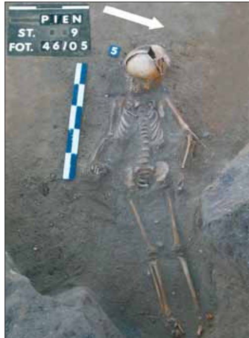
Ryc. 6. Pień, woj. kujawsko-pomorskie, stan. 9 (cmentarzysko). Grób 5