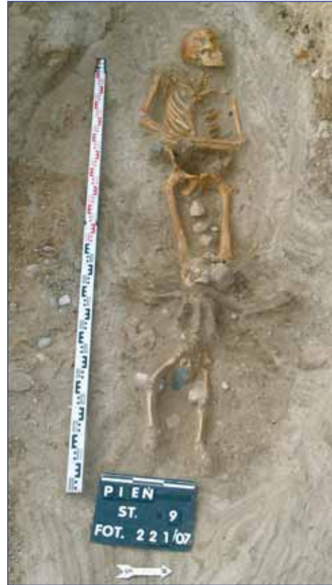
Ryc. 4. Pień, woj. kujawsko-pomorskie, stan. 9 (cmentarzysko). Grób 59a, b (Drozd A., Janowski A., Poliński D. 2010, s. 99)

Fig. 3. Pień, the Kuyavian-Pomeranian Voivodeship, site 9 (the burial ground). Grave 45