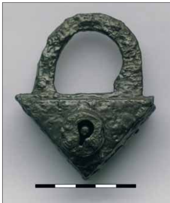
Fig. 8. Pień, the Kuyavian-Pomeranian Voivodeship, site 9 (the burial ground). A padlock from grave 3

zaczęły pojawiać się w kulturze materialnej od drugiej połowy XV w., jednak w materiałach archeologicznych występują dopiero od XVII w. Z kontekstu innych znalezisk wynika, że omawianą koronkę najprawdopodobniej datować można na XVII w. 30