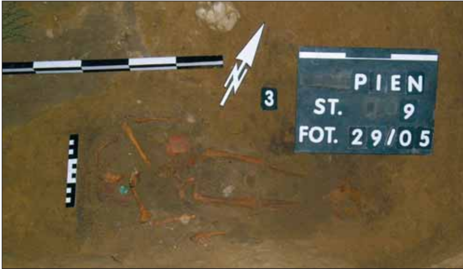
Ryc. 5. Pień, woj. kujawsko-pomorskie, stan. 9 (cmentarzysko). Grób 3