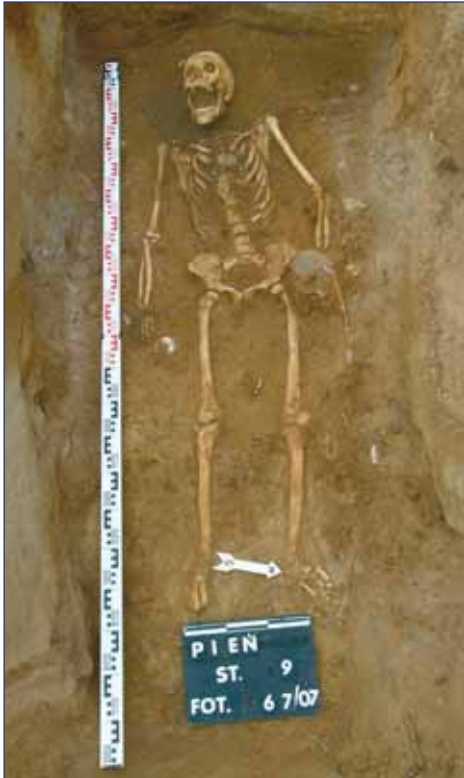
Ryc. 3. Pień, woj. kujawsko-pomorskie, stan. 9 (cmentarzysko). Grób 45

Fig. 3. Pień, the Kuyavian-Pomeranian Voivodeship, site 9 (the burial ground). Grave 45