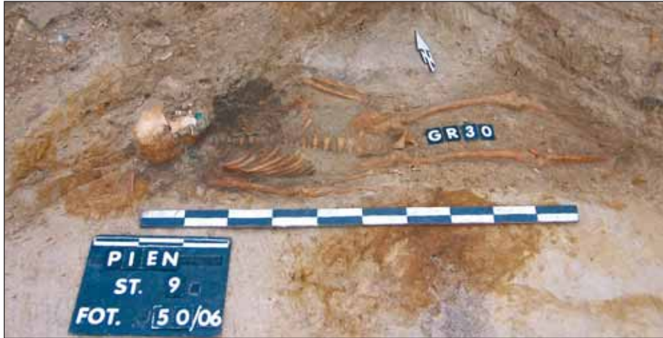
Ryc. 7. Pień, woj. kujawsko-pomorskie, stan. 9 (cmentarzysko). Grób 30