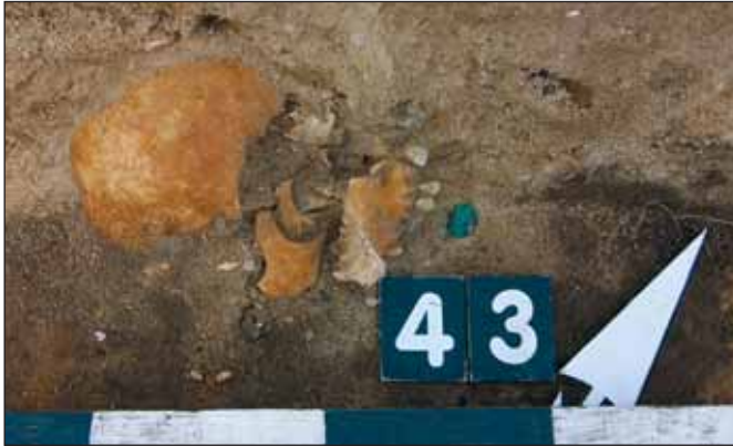
Ryc. 10. Pień, woj. kujawsko-pomorskie, stan. 9 (cmentarzysko). Moneta w grobie 30 (in situ)

niektórych zjawisk tylko do cmentarzy protestanckich może być po prostu odzwierciedleniem aktualnego stanu badań 73 . Podjęto wprawdzie próby wyodrębnienia elementów charakterystycznych dla kultury sepulkralnej obu wyznań 74 . Różańce, medaliki i krzyżyki uznano za charakterystyczne dla grobów katolickich 75 , zaś klucze, pasy i inne elementy stroju dla protestanckich, przy czym w drugim przypadku część przedmiotów ma charakter symboliczny. Należy zauważyć, że w grobach obu wyznań mogą pojawić się monety, wianki i szpilki, aczkolwiek jest