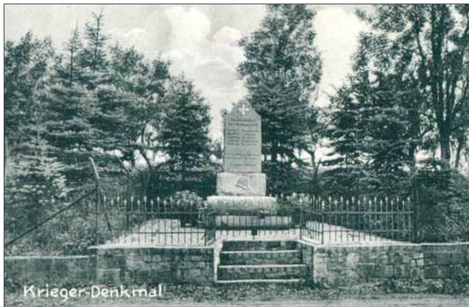
Ryc. 7. Pomnik poległych w pierwszej wojnie światowej w Tomicach, lata trzydzieste XX w.