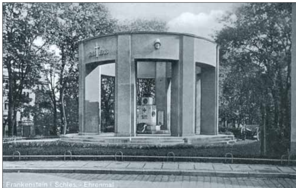
Ryc. 6. Przebudowany pomnik poległych w Zabkowicach Śląskich, po 1932 r.