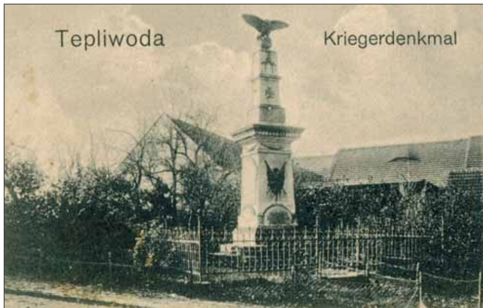
Ryc. 2. Pomnik poległych w Wojnach o Zjednoczenie Niemiec w Ciepłowodach, 1903 r.