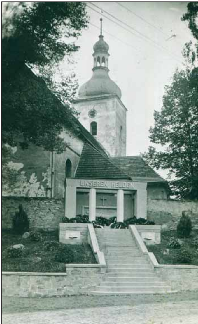
Ryc. 5. Pomnik poległych w I wojnie światowej w Starym Henrykowie, 1933 r.