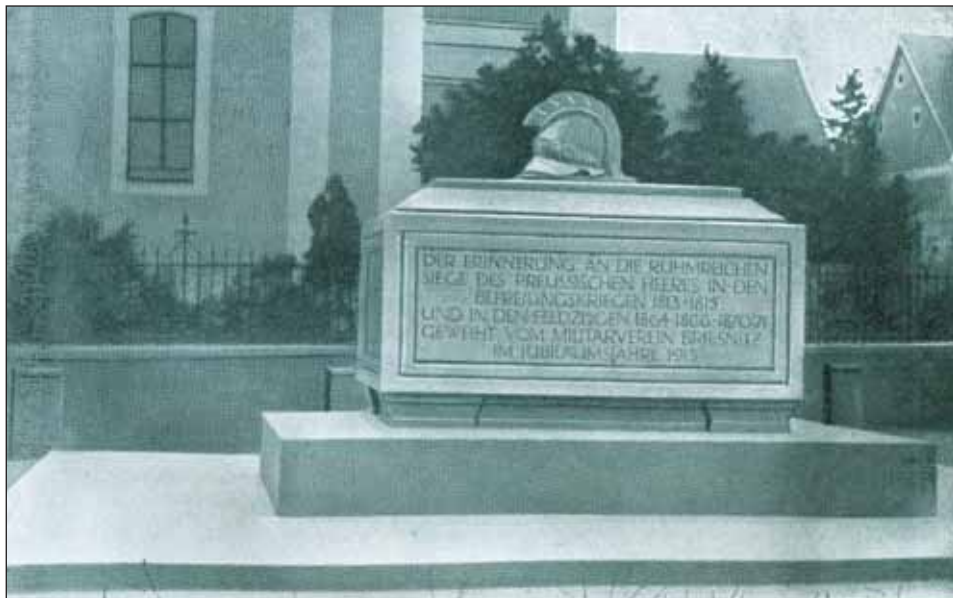
Ryc. 4. Pomnik poległych w Brzeźnicy, 1914 r., ze zbiorów autora