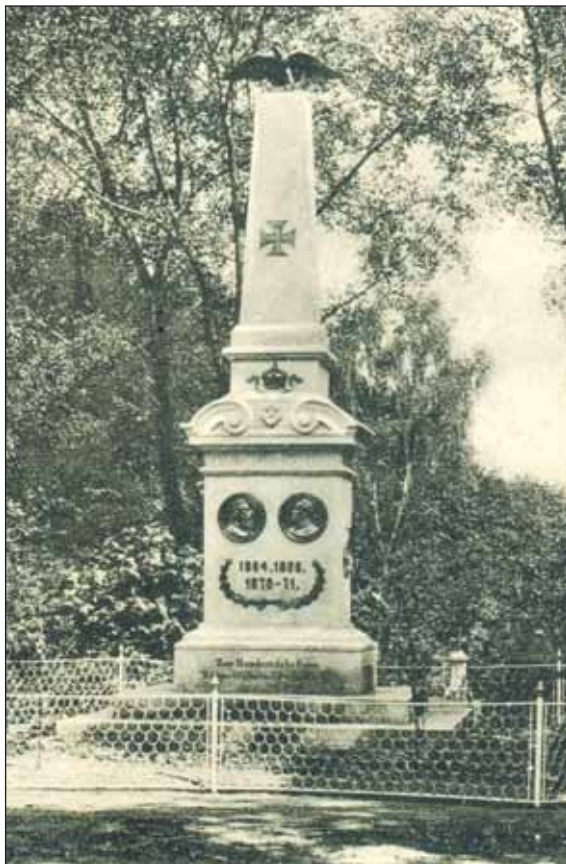
Ryc. 1. Pomnik poległych w Wojnach o Zjednoczenie Niemiec w Ząbkowicach Śląskich, 1898 r.