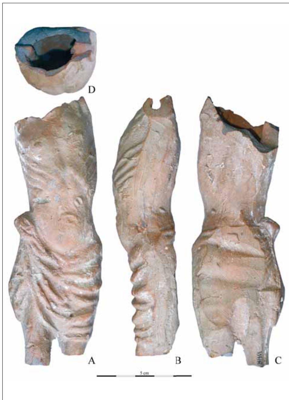
Ryc. 3. Stargard, Stare Miasto, kwartał IX. Figurka gliniana Chrystusa Ukrzyżowanego (sygn. 334/R/Kw/S). Fot. i oprac. M. Szeremeta