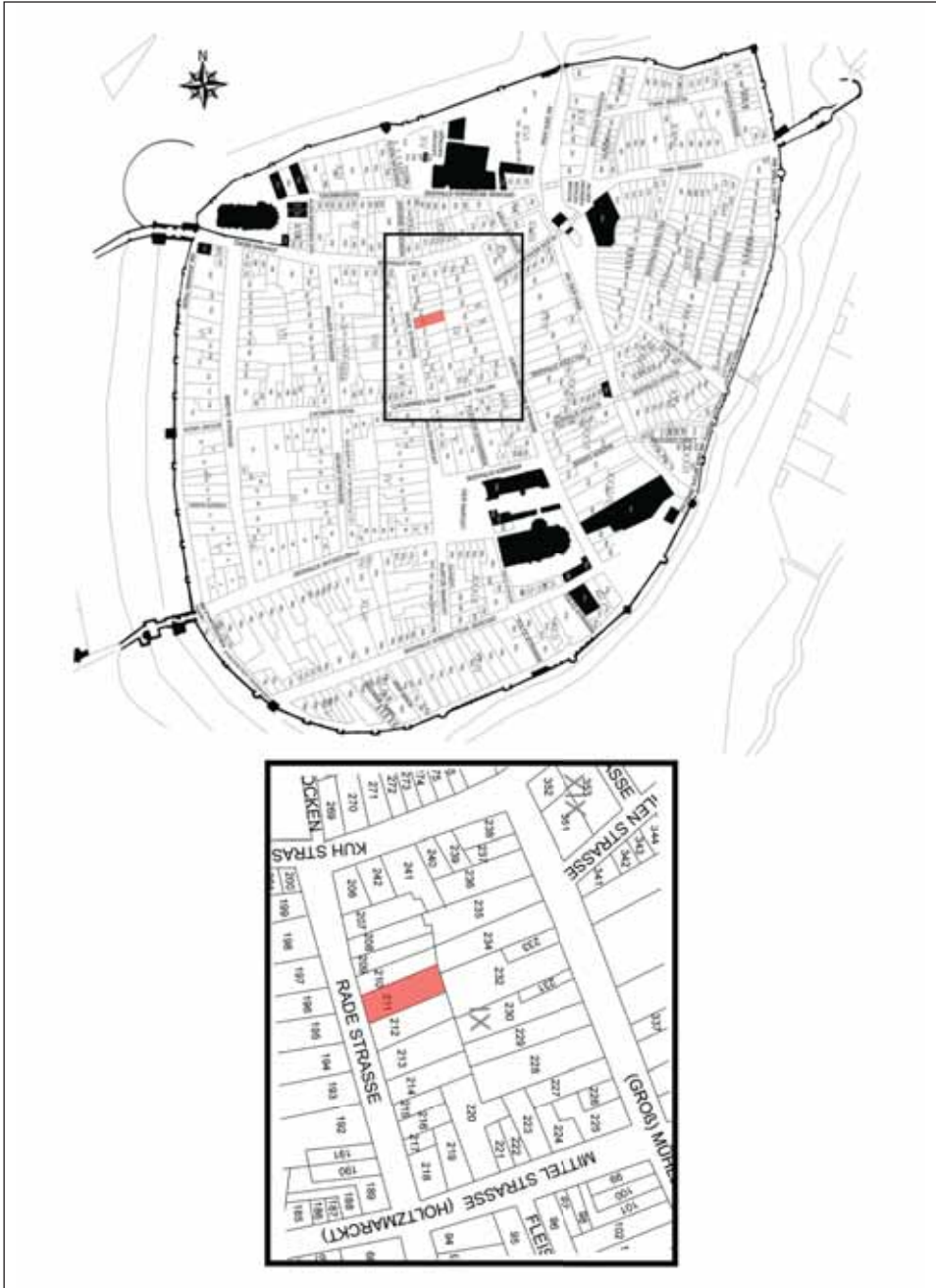
Ryc. 1. Stargard, Stare Miasto. Plan miasta według M.F. Schwedtkena z roku 1724 z zaznaczoną działką miejską, na której odkryto figurkę Chrystusa. Oprac. I. Wojciechowska, rys. C. Rysz

Fig. 1. Stargard, the Old Town. A street plan after M. F. Schwedtken, 1724, with an indication of the plot on which the figurine of Christ was found. Compiled by I. Wojciechowska, drawn by C. Rysz