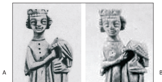
Ryc. 2. Fragmenty górnych części rękojeści noży z dwiema postaciami: A — Roskilde ( www.gothicivories.courtauld.ac.uk/images/ivory/3D264F49_91870322.html , dostęp 14.05.2015 r.) B — Nowy Jork ( www.gothicivories.courtauld.ac.uk/images/ivory/e6a45fd1_47fe56c3.html , dostęp 12.07.2014 r.)

Fig. 1. Fragment of the two-figure handle of the Roskilde knife, viewed from the front and the back; the man's shoes and the different length of the man's and the woman's clothing are visible; www.gothicivories.courtauld.ac.uk/images/ivory/3D264F49_91870322.html (accessed 14.05.2015)