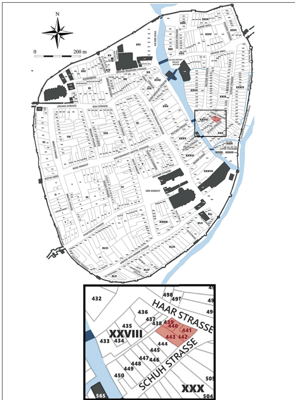
Ryc. 1. Stargard, Stare Miasto. Plan miasta według M.F. Schwedtkena z 1724 r. z zaznaczonym terenem badań w części tzw. kwartału XXVIII. Oprac. I. Wojciechowska, rys. M. Szeremeta