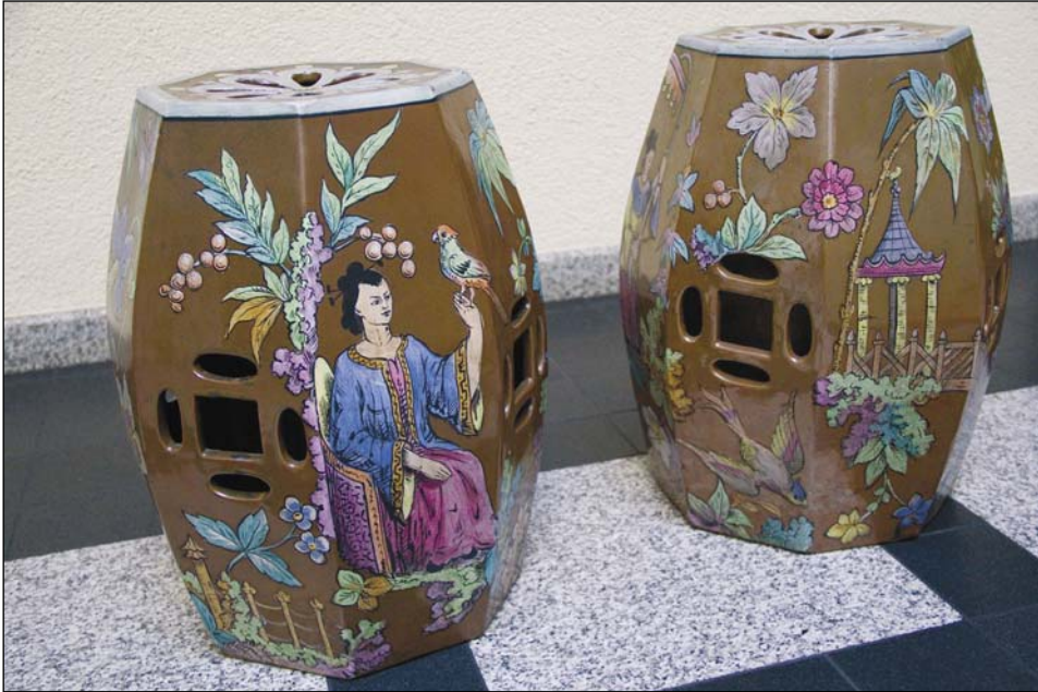
Ryc. 5. Taborety kamionkowe z Ćmielowa, w zbiorach Muzeum Mazowieckiego w Płocku