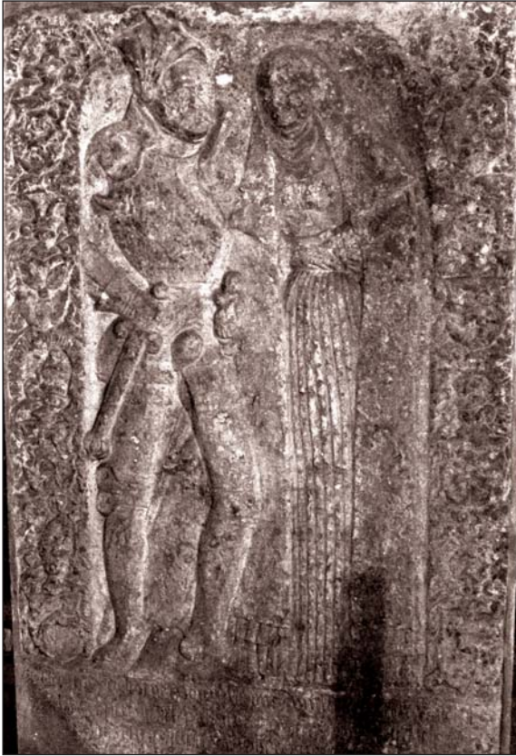
Ryc. 9. Wolf von Borcke. Płyta nagrobna z 1569 r.