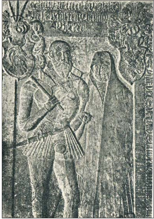
Ryc. 4. von Kameke. Płyta nagrobna z 1550 r. (za: Glińska M. 1973, ryc. 16)

Literatura: Böttger L. 1889, s. 88–89; Glińska M. 1973, s. 334–335; Puławski A. 2016b, s. 181–232; Puławski A. 2017, s. 81.