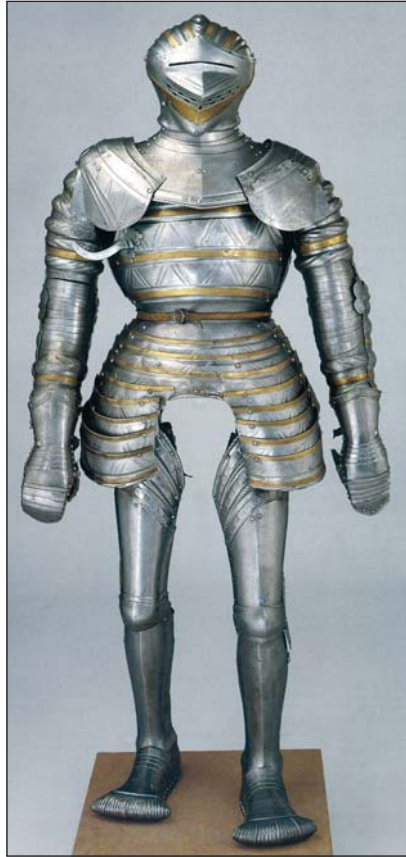
Ryc. 12. Zbroja kostiumowa z ok. 1550 r. (za: Burg und Herrschaft. 2010, ryc. 6.12)

Identyczne zdobienie występuje na folgowanym fartuchu i taszkach, które na epitafium Gryfity są mało widoczne, jedynie fragmentarycznie spod wycięć na poły w kanelowanej spódniczce. Zakładając, że zabytek z berlińskiego muzeum jest uzbrojeniem należącym niegdyś do Bogusława X, na co dobitnie wskazują analogie pomiędzy wyobrażeniem na płaskorzeźbie a oryginałem, może to być poszlaka na temat garnituru zbroi tego księcia. Kolejne podobieństwa dotyczą konstrukcji hełmu. Identyczne są: zasłona typu „wróbel dziób” i dzwon, który dekorują rzędy żłobków, idące równoległe do niskiego grzebienia. Hełm także zdobiony jest złotymi pasami, które na zasłonie przebiegają poziomo pod otworami oddechowymi, zaś na dzwonie pomiędzy żłobkami. Mimo licznych analogii pomiędzy zbroją wyrzeźbioną przez Hansa Peissera a autentycznym obiektem nie brak też różnic. Na napierśniku rzeźbiarz nie umieścił haka do podtrzymywania kopii, który znajduje się na zabytkowym uzbrojeniu. Może to wynikać z uproszczeń zastosowanych przez artystę 33 . Natomiast odwrotnie jest ze skrzydłem płotu nara-