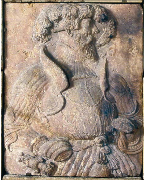
Ryc. 2. Filip I. Płyta fundacyjna z 1546 r. (za: Złoty wiek Pomorza. 2013, ryc. 163)

Fundator przedstawiony w półpostaci, w kapeluszu dekorowanym pióropuszem, z podwójnym łańcuchem z medalionem, przepasany szarfą zawiązaną na węzeł, na której zawieszane są po prawej stronie sztylet, a po lewej miecz. Prawa ręka księcia spoczywa na biodrze, lewa na rękojeści broni siecznej. Zbroja płytowa, maksymiliańska. Trzyfolgowy kanelowany obojczyk, napierśnik bombiasty z krótkim fartuchem, który na stałe połączony jest z taszkami. Widoczny saczek. U góry napierśnik wydaje się być ścięty poziomo, po prawej stronie — hak pod kopię. Naramienniki z płótem, opachy trzyfolgowe u góry, nałokietniki ze skrzydełkami otwartymi, zarękawia i rękawice mitynki z klepsydratowymi mankietami. Zbroja zdobiona kanelurami.