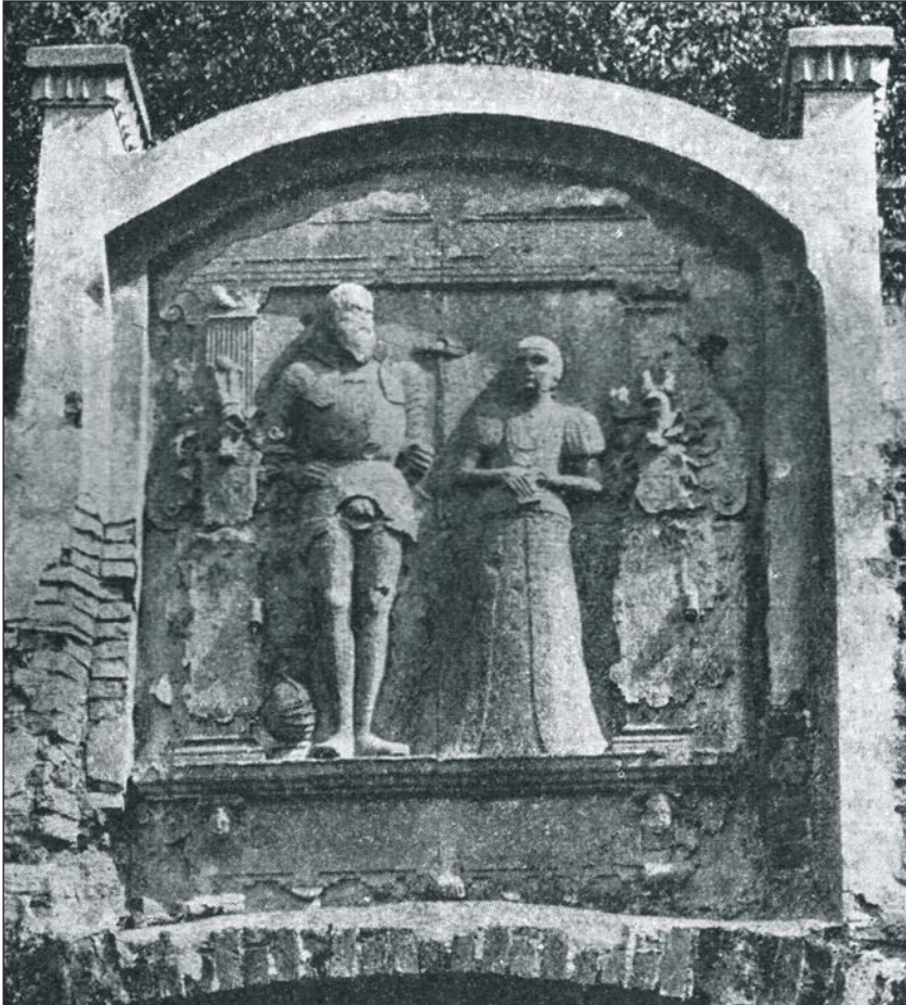
Ryc. 8. Ulrich I von Schwerin. Płyta fundacyjna z 1567 r. (za: Lemcke H. 1899, ryc. 112)