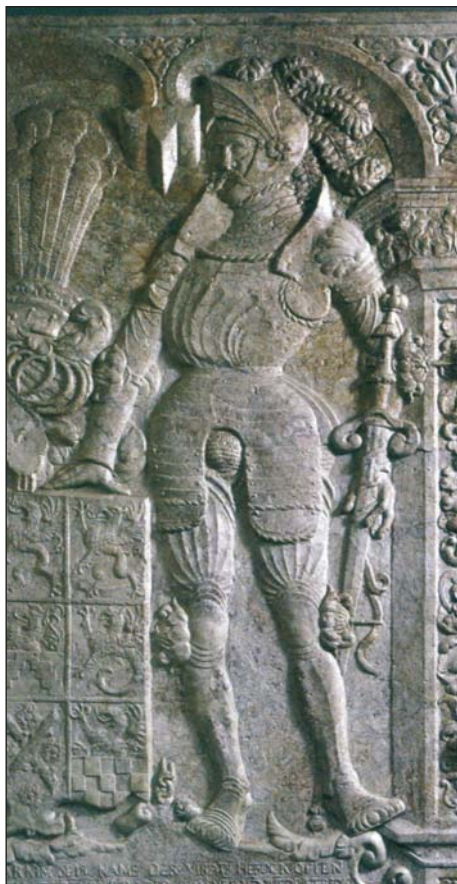
Ryc. 1. Barnim III. Płyta fundacyjna z 1543 r. (za: Krasnodębska K. 2013, ryc. 56)

Fig. 1. Barnim III. A foundation plaque from 1543 (after: Krasnodębska K. 2013, fig. 56)