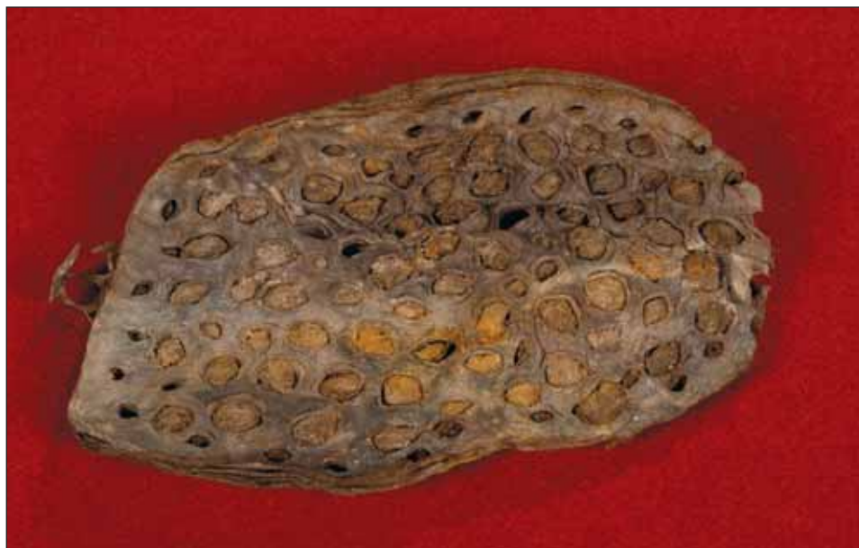
Ryc. 3. Kołkowane wzmocnienie przedstopia spodu obuwia z XIV–XV w. z badań Helgeandsholmen w Sztokholmie ( https://stockholmskallan.stockholm.se/post/6858 , dostęp 01.03.2020 r.)