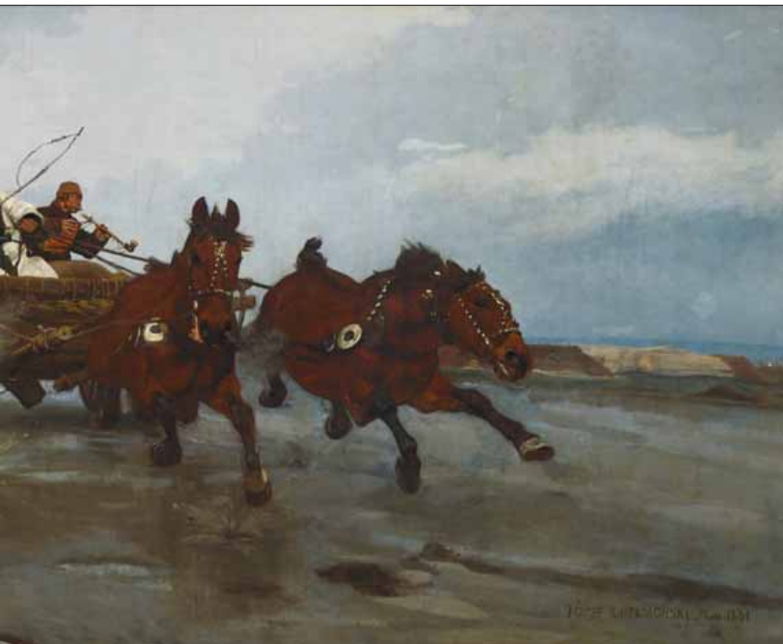
Ryc. 1. Józef Chełmoński, Czwórka , 1881 r., w zbiorach Muzeum Narodowego w Krakowie (nr inw. MNK II-a-258)

Fig. 1. Józef Chełmoński, Four-in-hand , 1881, in the collection of the National Museum in Cracow (inventory no. MNK II-a-258)