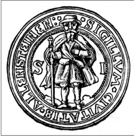
Ryc. 1. Pieczęć większa Olsztyna z XVI w. (Voßberg F.A. 1843, s. 48)

Na Warmii, terytorium dominium biskupiego, znamy co najmniej dziewięć ośrodków, w których w różnych okresach i w różnej liczebności działali złotnicy. Są to: Bisztynek 3 , Braniewo 4 , Dobrze Miasto 5 , Jeziorany 6 , Lidzbark Warmiński 7 , Orneta 8 , Reszel 9 i Olsztyn 10 . To ostatnie z wymienionych miast, wysunięte najdalej na południe Warmii, wedle dzisiejszej wiedzy przez wieki nie było ośrodkiem złotniczym o większym znaczeniu, a informacje o tamtejszych złotnikach są skąpe. Rzemieślnicy tej specjalności działali tam jednak już przed połową XVI w., nie tworząc znaczącego środowiska artystycznego. Choć w końcu XVII w. pracował w mieście Michael Bartolomowicz (czynny w latach co najmniej 1679–1699), który na początku kolejnego stulecia przeniósł się do Dobrego Miasta (czynny do śmierci w 1733 r.) 11 , to dopiero w XVIII w. prawdziwą