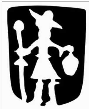
Ryc. 3. Miejski znak złotniczy Olsztyna z lat 1720–1745 (rys. J. Kriegseisen)