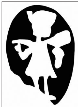
Ryc. 5. Miejski znak złotniczy Morąga z ok. 1775 r. (rys. J. Kriegseisen)

MK w ligaturze w prostokątnym polu. Przyjęcie takiej identyfikacji skutkowałoby koniecznością uznania, że drugi ze znaków olsztyńskich był używany aż do 1775 r. 22 Dokładniejsze przyjrzenie się miejskiemu oznaczeniu wybitemu na wspomnianych zabytkach z kościoła w Postolinie pozwala jednak stwierdzić, że mamy do czynienia z odrębną cechą, która różni się od używanej w Olsztynie, ale za to jest zgodna z godłem herbu Morąga.