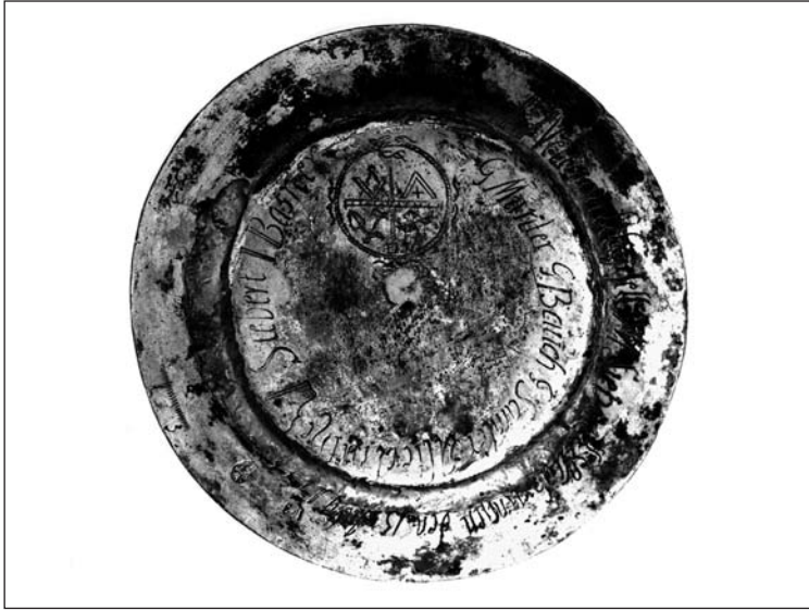
Ryc. 9. Patena, 1775 r., Morąg, Michael Kemberger