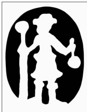
Ryc. 4. Miejski znak złotniczy Olsztyna z lat 1746–1756 (rys. J. Kriegseisen)