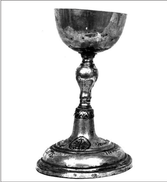
Ryc. 8. Kielich, 1775 r., Morąg, Michael Kemberger