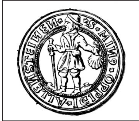
Ryc. 2. Pieczęć mniejsza Olsztyna z XVI w. (?) (za: Voßberg F.A. 1843, s. 48, tabl. XVIII, nr 65)

Fig. 1. The great seal of Olsztyn (Allenstein) from the 16 th c. (Voßberg F.A. 1843, s. 48)