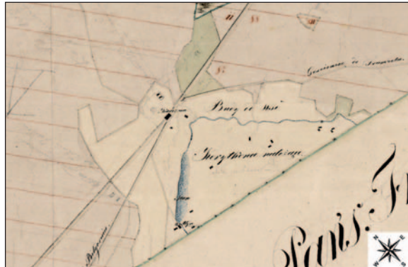
Fig. 3. Scattered huts near the village Korytków Duży, described on the map as “huts belonging to Korytków” (source: APL, AOZ, IMK OZ, catalogue no. 1150, fragment)

Ryc. 3. Rozproszone budy w okolicach wsi Korytków Duży, oznaczone na mapie jako „Budy do Korytkowa należące” (źródło: APL, AOZ, IMK OZ, sygn. 1150, fragment)