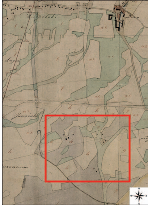
Fig. 12. Unidentified settlements to the south of Majdan Książpolski, marked with a square in the Plan of Majdan Książpolski from 1823

Wstępne badania terenowe przeprowadzono w miejscach wytypowanych na podstawie analizy przedstawionego powyżej materiału źródłowego, przy użyciu narzędzi georeferencyjnych (QGIS), koncentrując się na obszarach, które w późniejszym czasie nie były intensywnie użytkowane rolniczo bądź przemysłowo. Były to m.in. obszar lasów: Krasne (osady Wilkosy, Fusiarcz, Luchowscy), Chorosne (Kukielka), Ratajówka (Kobel, Rataje) oraz tzw. Rakowa w lasach terespolskich (osada Skórów).