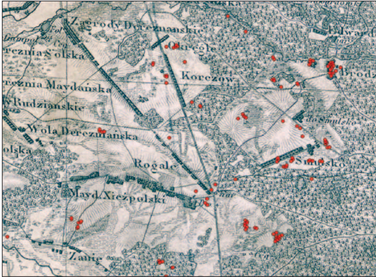
Ryc. 4. Zabudowania budziarzy (każda kropka oznacza jedną chałupę) sprzed regulacji gruntów z Planu wsi Majdan Książpolski (źródło: APL, AOZ, IMK OZ, sygn. 209), nałożone na Topograficzną Kartę Królestwa Polskiego (Karta. b.d.). Mapa kwatremistrzowska ukazuje już stan po regulacji gruntów