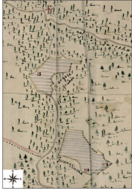
Fig. 10. The settlements of Margol and the Iwańczyk family in the Tychech woods in the Solska Forest. A map of Tarnogród forest from 1787 (source: APL, AOZ, IMK OZ, catalogue no. 1149, Tarnogród forest, fragment)