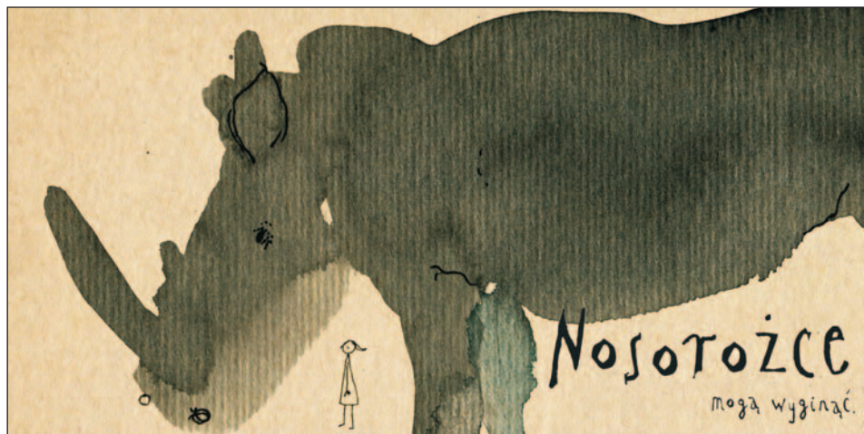
Ryc. 4. Justyna Stefańczyk, Eko song. Nosorożce mogą wyginąć , Wydawnictwo Dzika Małpa; źródło: Stefańczyk J. 2018b