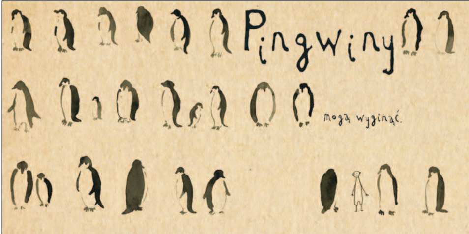
Ryc. 2. Justyna Stefańczyk, Eko song. Pingwiny mogą wyginąć , Wydawnictwo Dzika Małpa; źródło: Stefańczyk J. 2018b