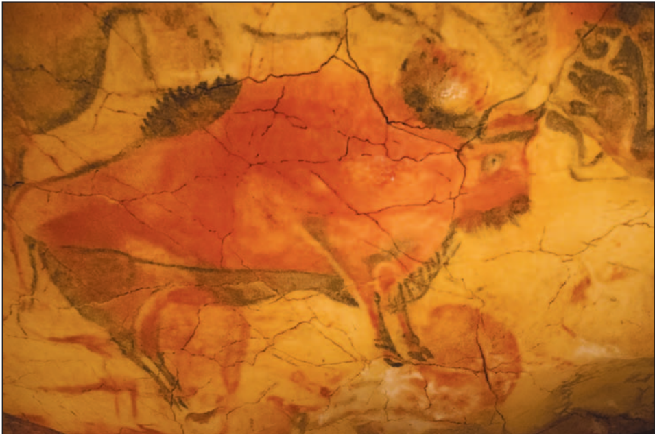
Ryc. 3. Bizon, Altamira, Hiszpania, paleolit