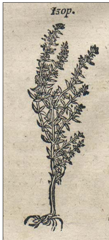
Ryc. 3. Hyzop.

Marcin, najczęściej, nie przestrzegał czytelnika przed przedawkowaniem leków w i środków upiększających, gdyż proponowane specyfiki były na ogół bezpieczne. Zalecał pewną ostrożność przy stosowaniu mięty nadwodnej, którą należało omywać twarz z wodą albo winem, „a to