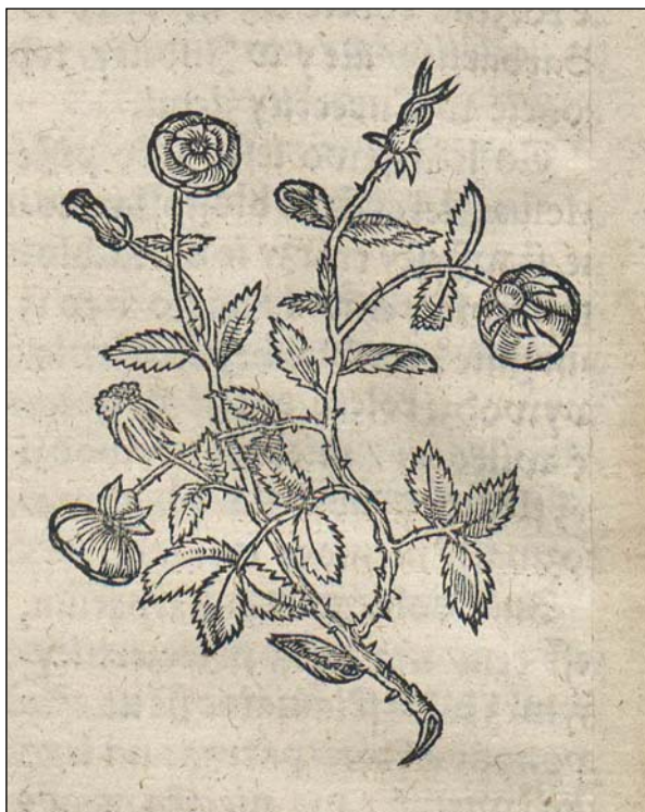
Ryc. 5. Róża. Źródło: Marcin z Urzędowa. 1595, s. 266