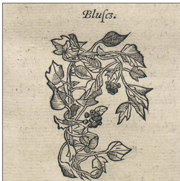
Ryc. 2. Bluszcz.