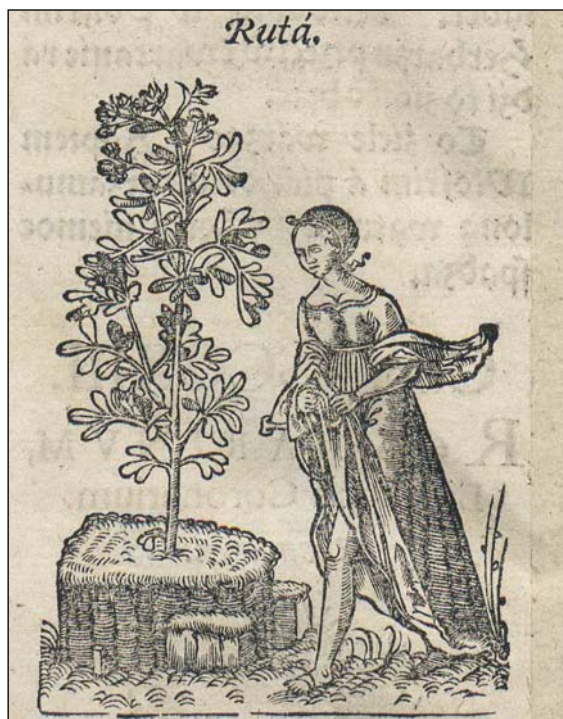
Ryc. 4. Ruta. Źródło: Marcin z Urzędowa. 1595, s. 270