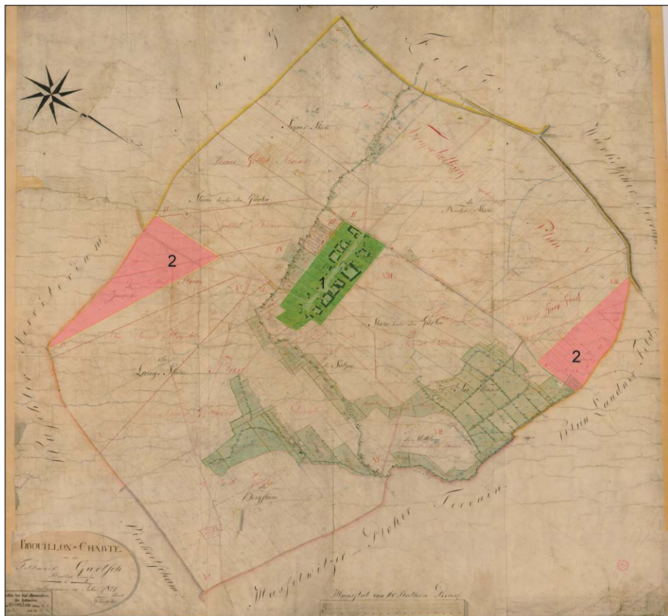
Ryc. 3. Rekonstruowany zasięg przymiarków we wsi Górzec:

1 — siedlisko wsi, 2 — rekonstruowane przymiarki (oprac. K. Fokt, M. Legut-Pintal na podstawie planu separacyjnego.)