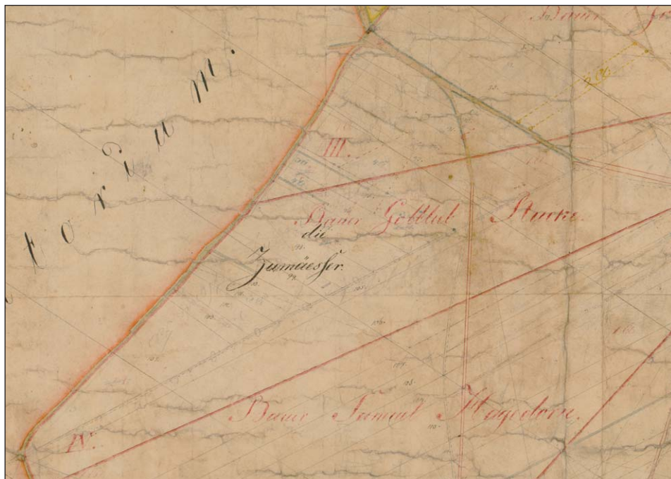
Ryc. 4. Fragment planu separacyjnego wsi Górzec z oznaczeniem nazwy polnej die Zumässer .

rozgraniczeń miejscowości i przewłaszczeń działek pomiędzy obrębami. W XIII–XIV w. obserwować można zanik największych przymiarków zarówno międzyobróbowych, jak też położonych wewnątrz obrębów wiejskich, w miejscu których zakładano folwarki i inne osiedla wiejskie. Zjawisko to trwało zresztą do epoki nowożytnej i należy je rozważać jako element procesu optymalizacji gospodarczego użytkowania przestrzeni osadniczej. Z tej samej perspektywy spojrzeć można na los pozostałych napłątków śląskich, które albo pozostawały przy dominiach, stając się gruntami folwarcznymi, albo podlegały sprzedaży sołtysom i/lub gromadom bądź parcelacji między kmieci lub ogrodników.