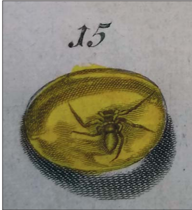
Ryc. 4.