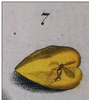
Ryc. 3.