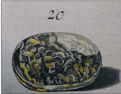
Ryc. 8.