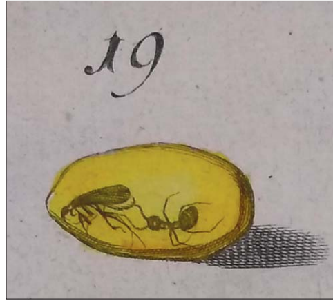
Ryc. 7.