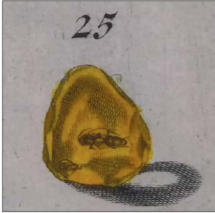
Ryc. 6.