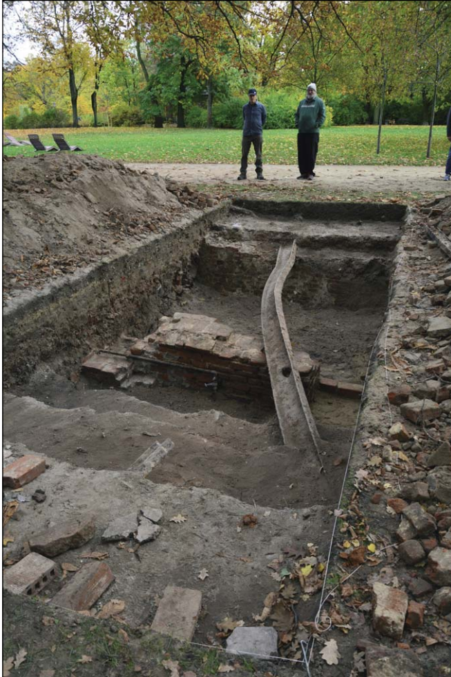
Ryc. 1. Prace wykopaliskowe w Ogrodzie Krasieńskich, październik 2021 r.