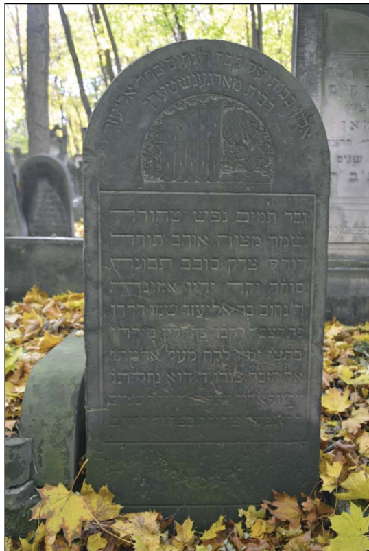
Ryc. 6. Nagrobek Nachuma Morgenszterna na cmentarzu żydowskim przy ul. Okopowej w Warszawie