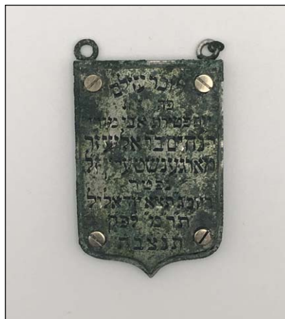
Ryc. 3. Srebrna zawieszka dedykacyjna znaleziona w Ogrodzie Krasińskich (przód), stan po konserwacji

Fig. 2. Silver dedicatory pendant found in the Krasiński Garden (obverse), condition after the initial mechanical cleaning