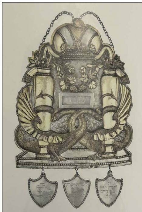
Ryc. 7. Tarcza na Torę z zawieszkami dedykacyjnymi, 1828 r., Muzeum Żydowskie w Pradze.

Fig. 7. Torah shield with dedicatory pendants, 1828, The Jewish Museum in Prague.