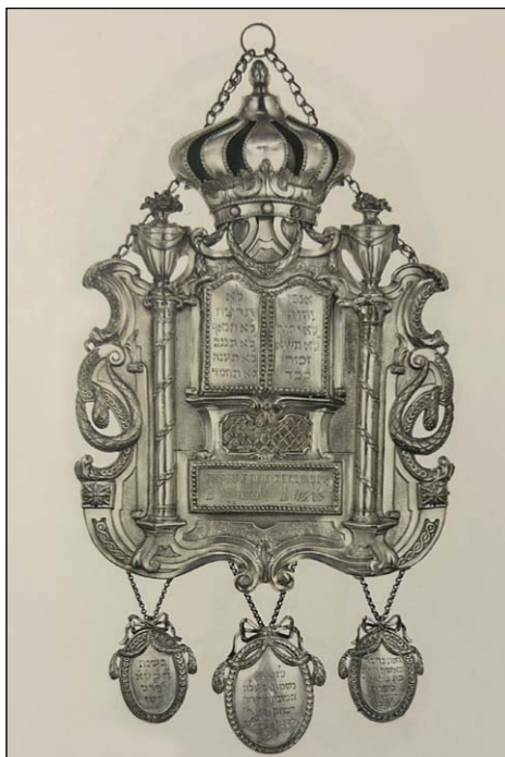
Ryc. 8. Tarcza na Torę z zawieszkami dedykacyjnymi, 1801 r., Muzeum Żydowskie w Pradze.

Fig. 8. Torah shield with dedicatory pendants, 1801, The Jewish Museum in Prague.