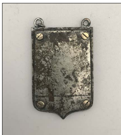
Fig. 4. Silver dedicatory pendant found in the Krasiński Garden (reverse), condition after the conservation