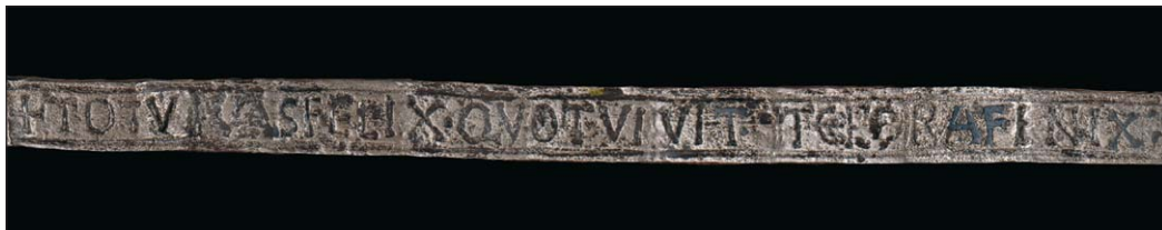
Ryc. 2. Tum, stan. 1. Rozwinięcie inskrypcji łacińskiej na pierścieniu z Tumu

+ TOT VIVAS FELIX QVOT VIVIT TEPORA FENIX: (= Tot vivas felix, quot vivit tempora fenix) 6 (metrum: tōt vī|vās fē|līx || qvōt| vīvīt| tēmpōrā |fēnīx|)