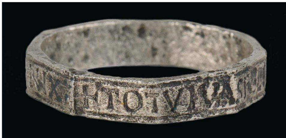
Ryc. 1. Tum, stan. 1. Pierścień wielokątny z inskrypcją

P odczas wykopalisk na grodzisku w Tumie pod Łęczycą w 2009 r. odkryto m.in. srebrny pierścień — dziewięciokątną obrączkę z inskrypcją na zewnętrznym polu szyny (ryc. 1). Opublikowane przez Waldemara Stasiaka i Ryszarda Grygiela pięć lat po odkryciu, znalezisko