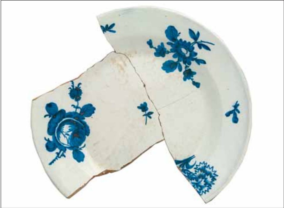
Ryc. 5. Talerz głęboki z manufaktury Hofrath Ehrenreich, 1786 r., odkryty w Elblągu.