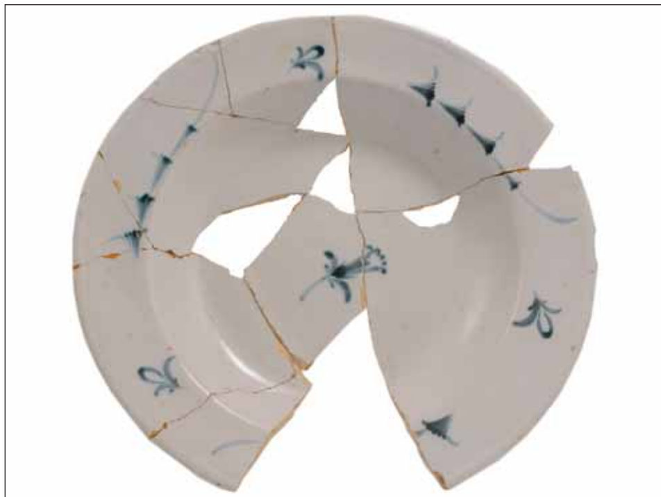
Ryc. 9. Talerz płytki, prawdopodobnie manufaktura Hofrath Ehrenreich, ostatnia ćwierć XVIII w.