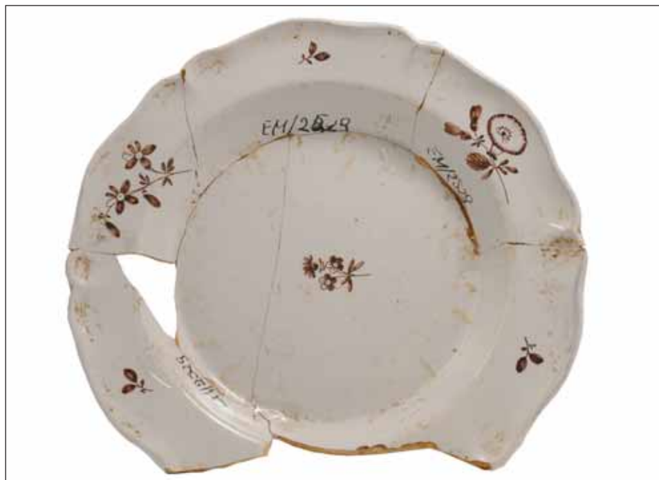
Ryc. 7. Talerz płytki, manufaktura Hofrath Ehrenreich, 1785 r., malowany przez Eryka (Erika) Hellmanna.