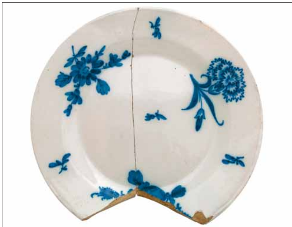
Ryc. 6. Talerz płytki z manufaktury Hofrath Ehrenreich, 1785 r., odkryty w Elblągu.