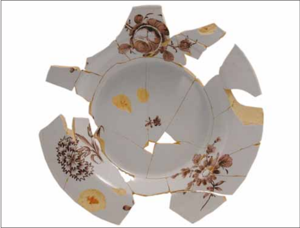
Ryc. 3. Talerz głęboki z manufaktury Hofrath Ehrenreich, 1785 r., odkryty w Elblągu.