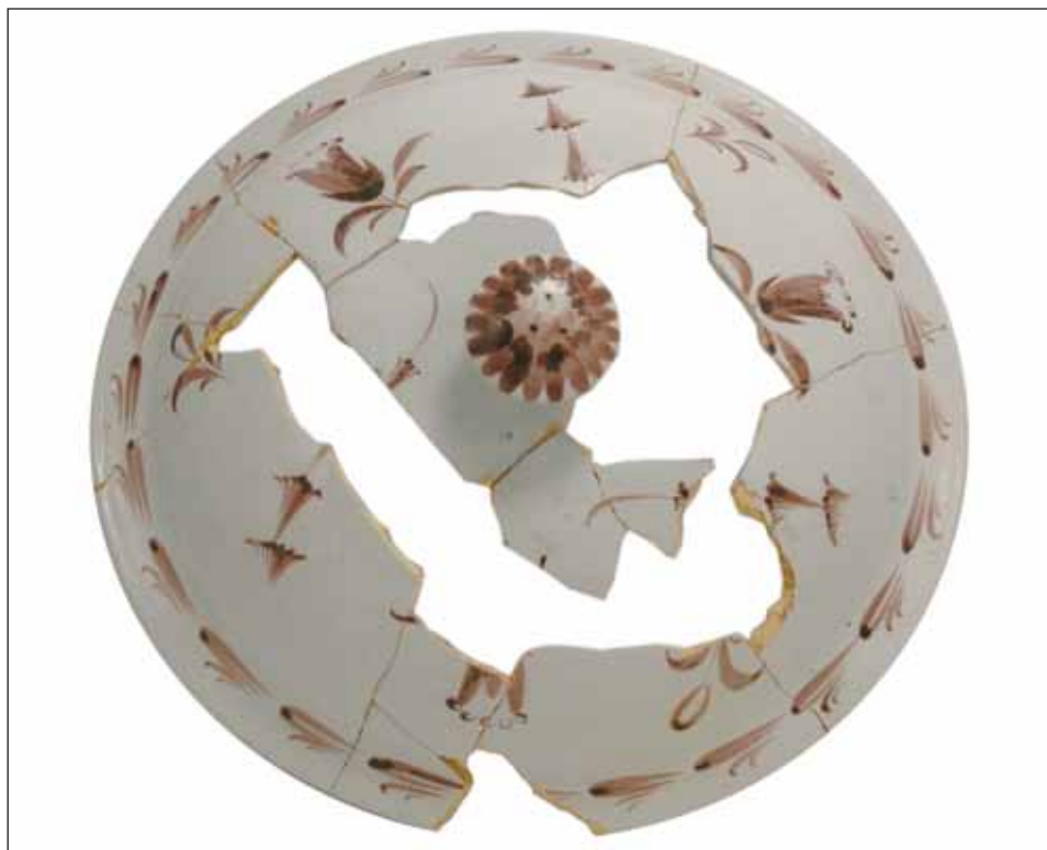
Ryc. 10. Pokrywka teryny z manufaktury Hofrath Ehrenreich, lata osiemdziesiąte XVIII w.