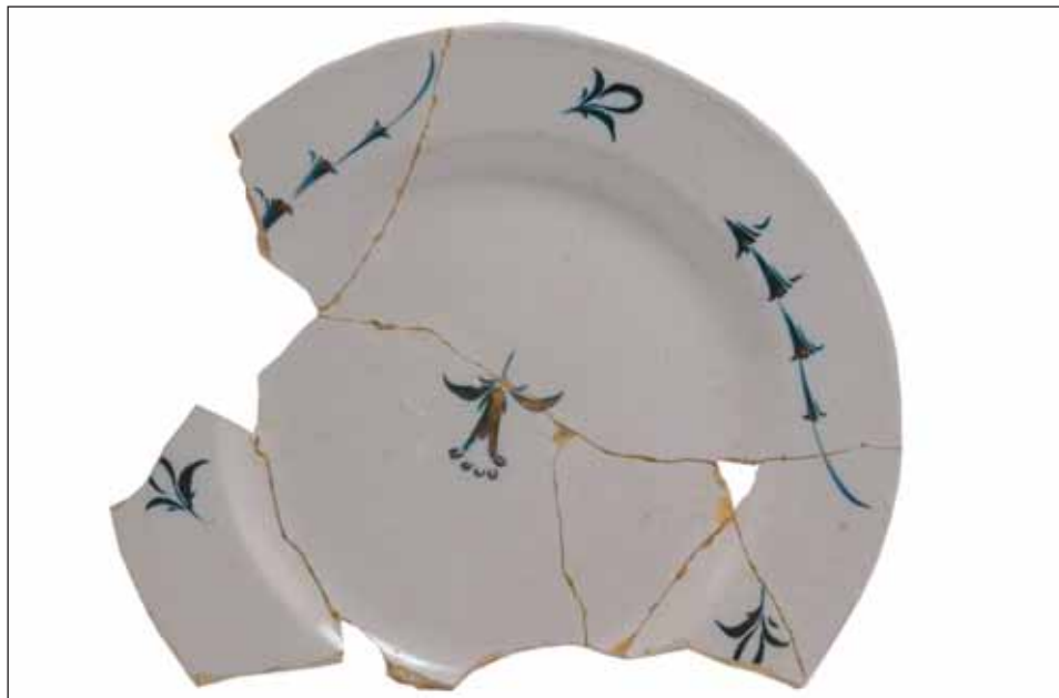
Ryc. 8. Talerz płytki, prawdopodobnie manufaktura Hofrath Ehrenreich, ostatnia ćwierć XVIII w.