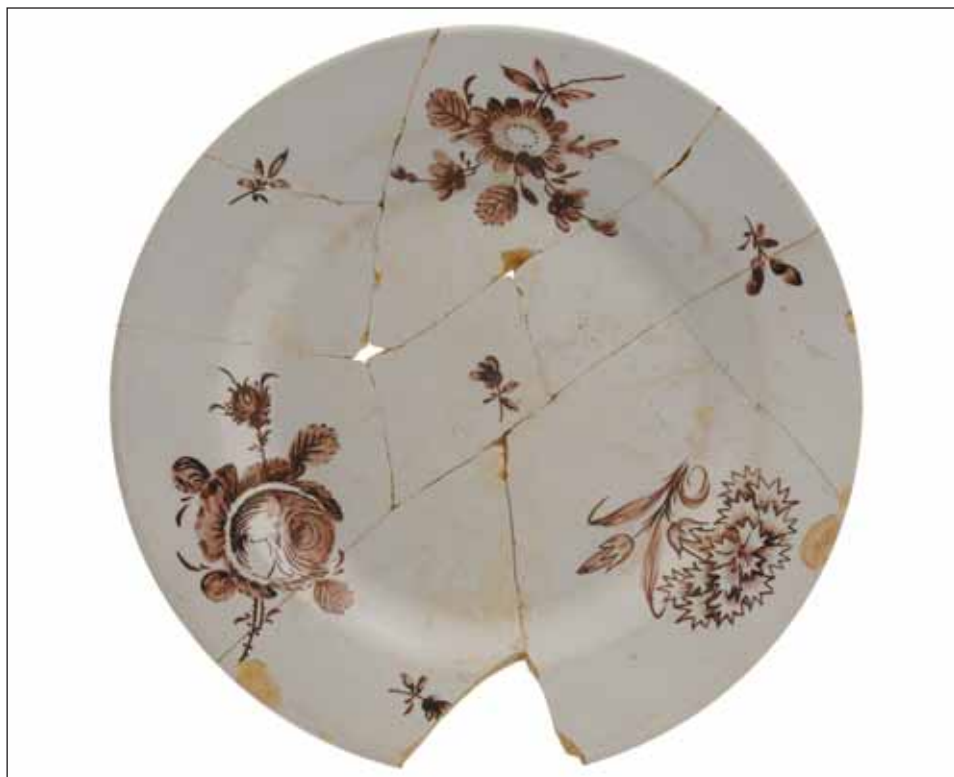
Ryc. 4. Talerz płytki z manufaktury Hofrath Ehrenreich, 1785 r., odkryty w Elblągu.