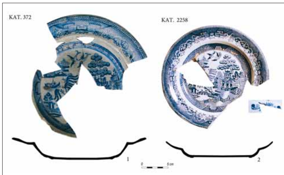
Ryc. 3. Angielskie talerze z dekoracją Willow , z drugiej połowy XIX w., z badań archeologicznych w Gdańsku: 1 — przy ul. Sadowej, 2 — przy ul. Wałowej.