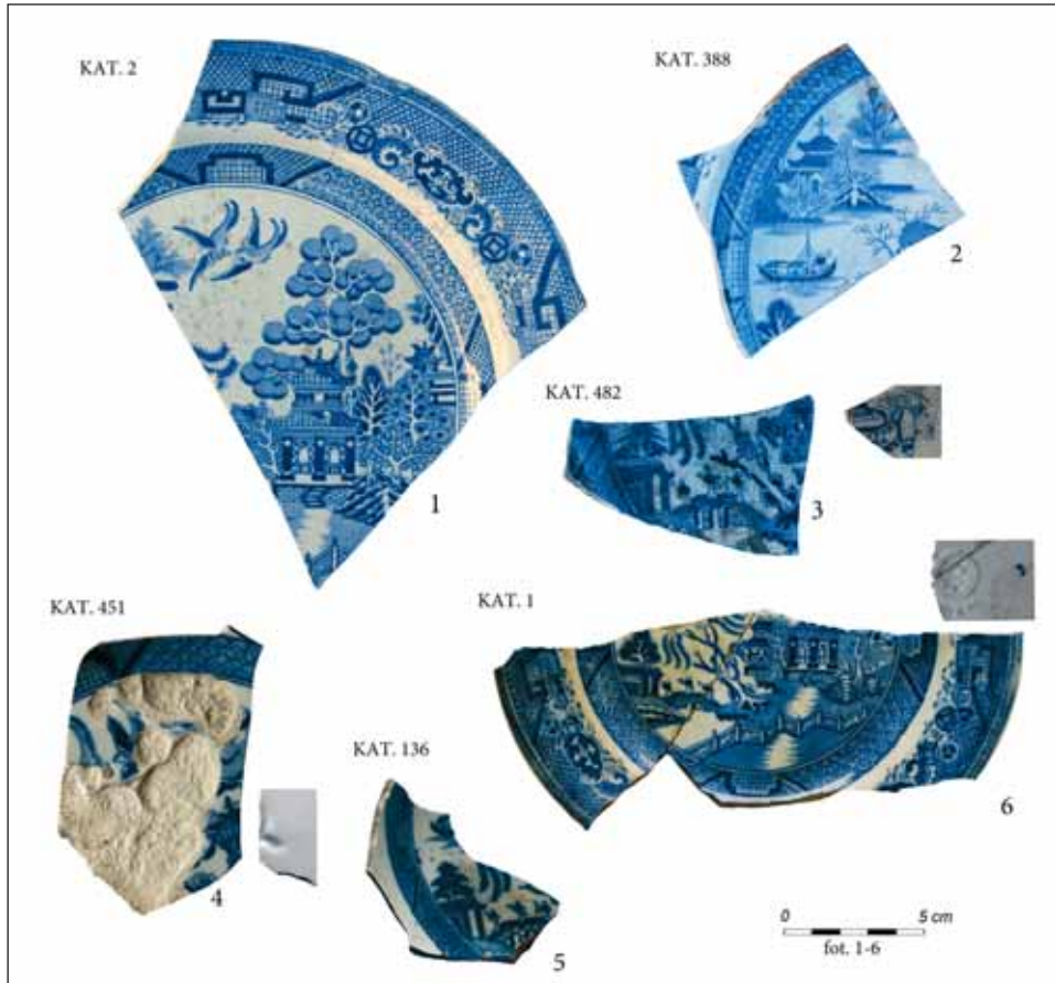
Ryc. 2. Angielskie talerze z dekoracją Willow , naczynia z badań archeologicznych w Gdańsku: 1, 6 — przy ul. Górka/Rogaczewskiego; 2-4 — przy ul. Sadowej; 5 — przy Pl. Stoczniovym.