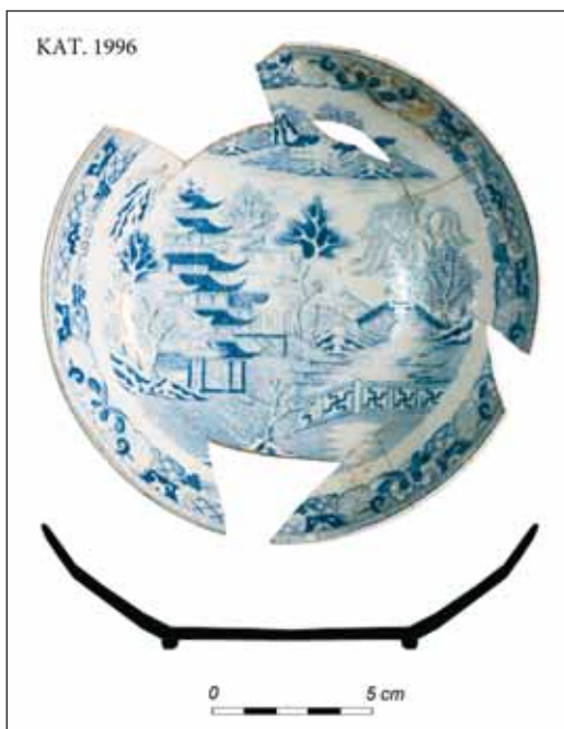
Ryc. 7. Angielski spodek z dekoracją Two Temples II , z pierwszej połowy XIX w., z badań archeologicznych przy ul. Wałowej w Gdańsku.

Na mapie miast południowego Bałtyku Gdańsk był jednym z większych odbiorców fajansów angielskich 34 oraz ich głównym reeksporterem w głąb kraju. Niemniej jednak liczba wyrobów z nadrukiem w formie Willow lub z wariantami tego zdobienia jest w skali Gdańska marginalna i na pewno nie stanowiły one głównego nurtu importu fajansów angielskich. Głównym kierunkiem eksportu z Anglii tak dekorowanych naczyń była Ameryka Północna 35 . Świadczą o tym liczne egzemplarze znajdujące podczas badań archeologicznych, a także całe zasta-