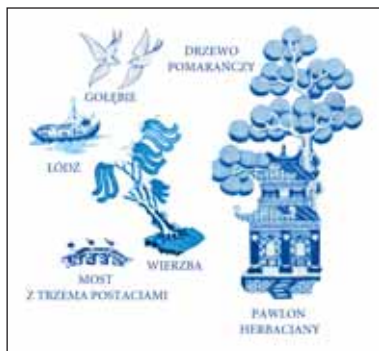
Ryc. 1. Elementy standardowej dekoracji Willow, oprac. J. Dąbal