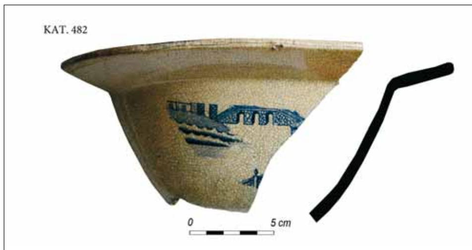
Ryc. 5. Angielska miska z uproszczoną dekoracją Willow , z pierwszej ćwierci XX w., z badań archeologicznych przy Pl. Stoczniowym w Gdańsku.