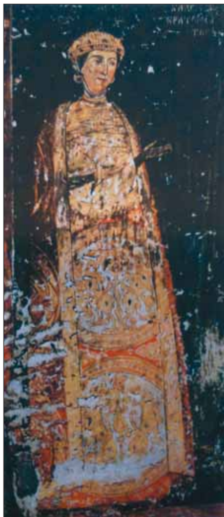
Ryc. 2. Wizerunek Desislawy, za: A. Haduch, R. Liwoch, Kołtki z południowo-zachodniej Rusi , s. 44, rys. 1