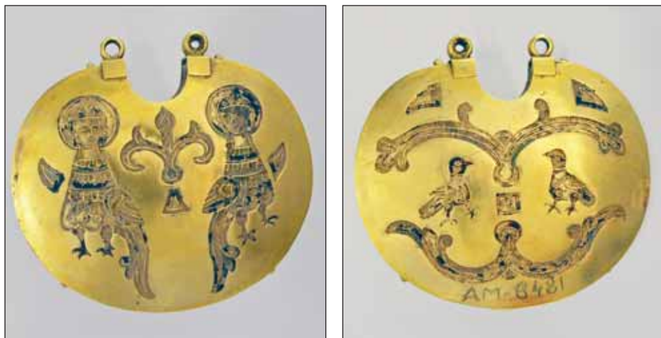
Ryc. 8. Kołt, XII–początek XIII w., Kijów, skarb odkryty w 1847 r., za: Muzeum Historycznych Skarbów Ukrainy. Katalog , 2011, s. 39