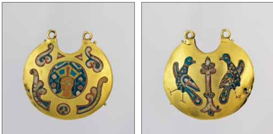
Ryc. 3. Kołty parzyste, XII–początek XIII w. Kijów, skarb odkryty w 1876 r., za: L. Pekarska, Jewellery of Princely Kiev... , s. 114–115, rys. 5.27