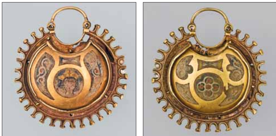
Ryc. 5. Kołty parzyste, XII–początek XIII w., Kijów, skarb odkryty w 1949 r., za: Muzeum Historycznych Skarbów Ukrainy. Katalog , 2011, s. 39