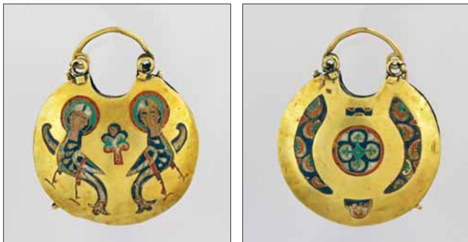
Ryc. 4. Kołt, XII–początek XIII w., Kniaża Góra, obwód Czerkaski, skarb odkryty w 1896 r., za: Muzeum Historycznych Skarbów Ukrainy. Katalog , 1999, s. 54