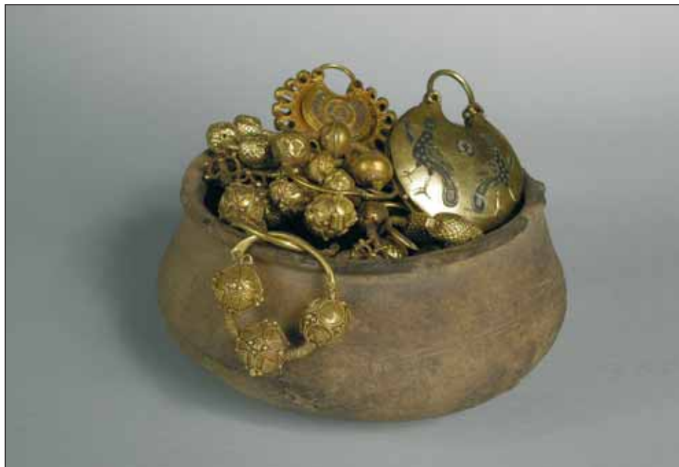
Ryc. 1. Ozdoby ze skarbów kijowskich, XII–początek XIII w., za: Muzeum Historycznych Skarbów Ukrainy. Katalog , 2004

Ważnym elementem kultury materialnej dawnej Rusi, stanowiącym uzupełnienie ubioru, były luksusowe wyroby złotnicze. Składały się na nie różne typy ozdób: diademy, barmy, naszyjniki, oczelja (pol. naczółki), kołty, rjasny, zausznice, bransolety i pierścionki (ryc. 1). Ponieważ kołty, a także wzmiankowane inne elementy biżuterii są typowe tylko dla Rusi, wymagają wyjaśnienia.