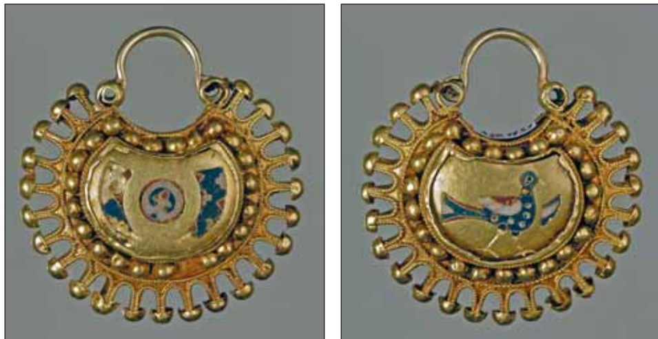
Ryc. 6. Kołty parzyste, XII–początek XIII w., Kniaża Góra, obwód Czerkaski, skarb odkryty w 1897 r., za: Muzeum Historycznych Skarbów Ukrainy. Katalog , 1999, s. 55

Fig. 6. A pair of kolts, the 12 th –early 13 th c., Kniazha Gora, province of Cherkasy, a hoard discovered in 1897, after: Muzeum Historycznych Skarbów Ukrainy. Katalog , 1999, p. 55