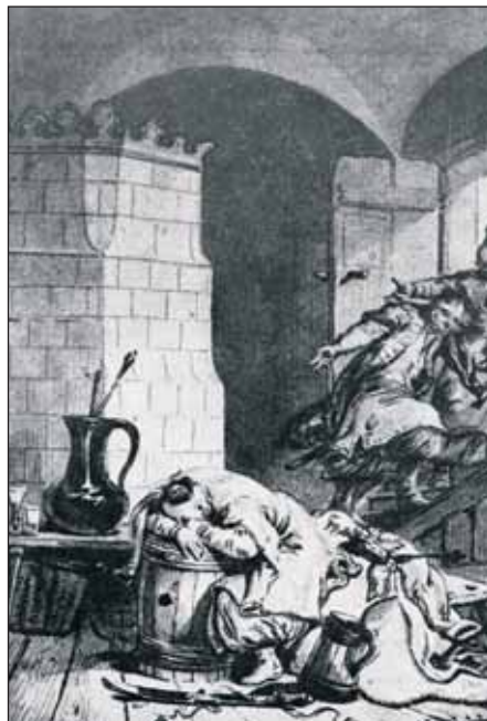
Fig. 1. A wine glass and a glass on a bench at a tiled stove in a flat. Drawn by Jan Piotr Norblin, Król Popiel pijany śpi na beczce , [The drunk King Popiel sleeping on a barrel], an illustration to Canto X of Myszeida by Ignacy Krasicki, 1775, after: A. Kępińska, Jan Piotr Norblin , Wrocław 1978, fig. 24

saksońskie oraz śląsko-czeskie, a w drugiej połowie tego stulecia także angielskie 41 . Centrum handlu szkłem czeskim i brandenburskim był wtedy Gdańsk 42 .