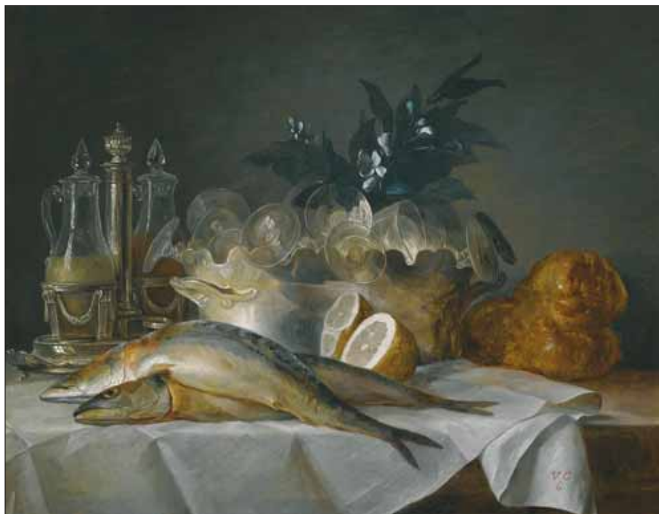
Ryc. 3. Kieliszki w misie do schładzania szkła oraz karafinki do octu i oliwy, elementy martwej natury, Anne Valleyer-Coster, Martwa natura z makrelą , 1787 r., za: A. Polak, Szkle i jego historia , Warszawa 1981, s. 244, fot. 71; domena publiczna, https://commons.wikimedia.org/wiki/File:Anne_Valleyer-Coster_-_A_still_life_of_mackerel_glassware_a_loaf_of_bread_and_lemons_on_a_table_with_a_white_cloth.jpeg

Fig. 3. Glasses in a cooling bowl and oil and vinegar carafes as elements of a still life, Anne Valleyer-Coster, Martwa natura z makrelą , [Still life with a mackerel], 1787, after: A. Polak, Szkle i jego historia , Warszawa 1981, p. 244, photo 71; public domain, https://commons.wikimedia.org/wiki/File:Anne_Valleyer-Coster_-_A_still_life_of_mackerel_glassware_a_loaf_of_bread_and_lemons_on_a_table_with_a_white_cloth.jpeg