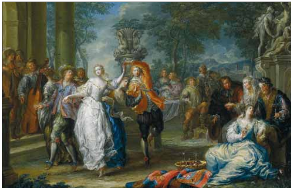
Ryc. 5. Kieliszki, dzbany i karafka, używane podczas spotkania towarzyskiego w parku, Johann Georg Platzer, Wesołe towarzystwo w parku , XVIII w. (przed rokiem 1761), ze zbiorów Muzeum Narodowego w Warszawie, domena publiczna, https://wolnelektury.pl/katalog/obraz/platzer-wesołe-towarzystwo-w-parku/

Fig. 5. Glasses, jugs and a decanter, used at a meeting in a park, Johann Georg Platzer, Wesołe towarzystwo w parku , [A merry company in a park], 18th c. (before 1761), the National Museum in Warsaw, public domain, https://wolnelektury.pl/katalog/obraz/platzer-wesołe-towarzystwo-w-parku/