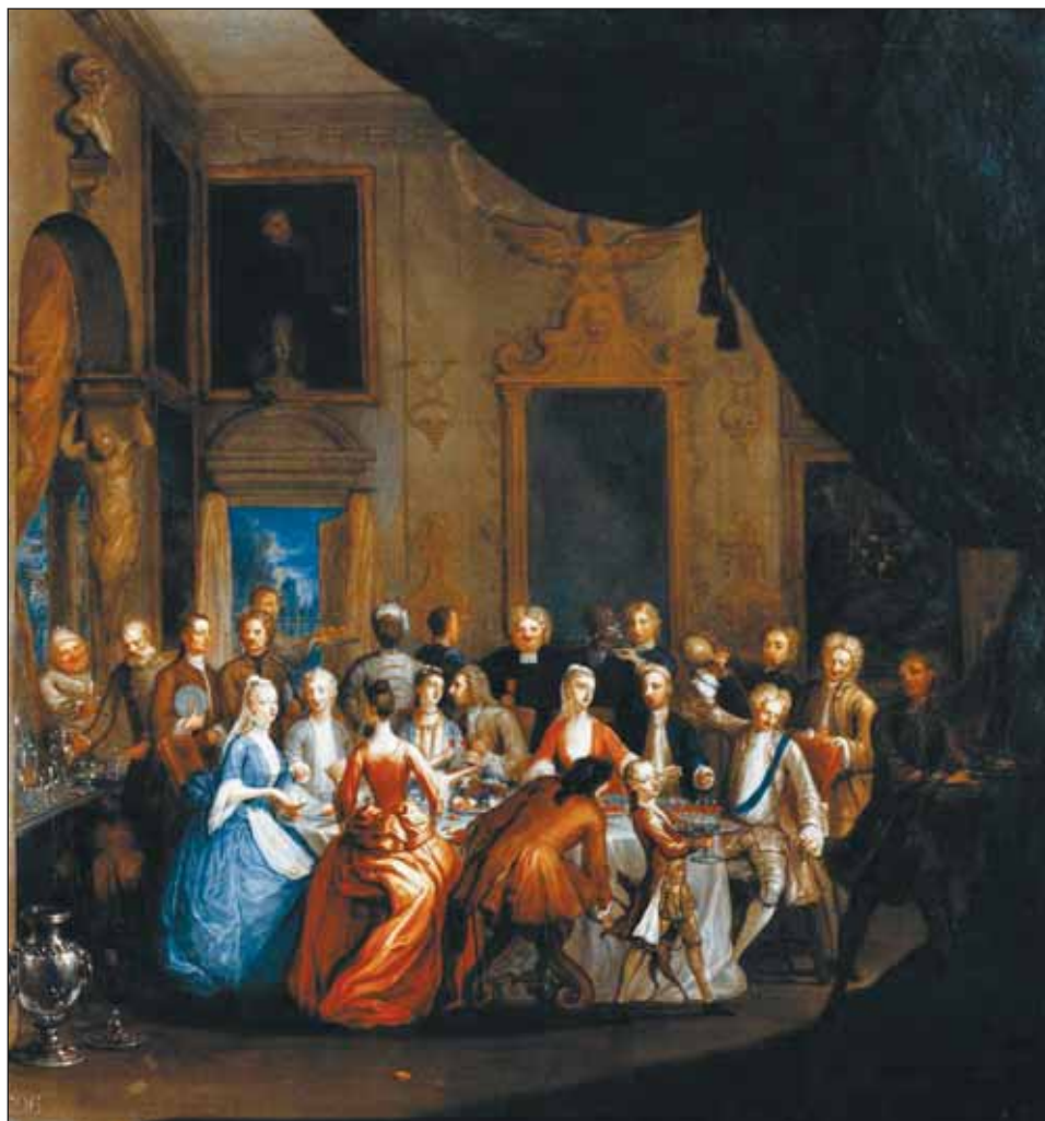
Ryc. 4. Kieliszki, dzbany i butelka, używane podczas wystawnej uczyty w reprezentacyjnym wnętrzu, Marcellus Laroon the Younger, A Dinner Party , 1725 r., za: D.P. Lanmon, The Golden Age of English Glass 1650–1775 , Woodbridge 2011, s. 100–101, ryc. 63a–c