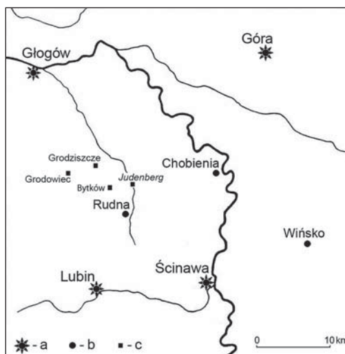
Fig. 1. The location of Judenberg and the nearby Jewish communities in the Duchy of Głogów (a) in relation to nearby towns (b) and to nearby villages (c). Drawn by D. Nowakowski

tłe źródeł pisanych i archeologicznych 16 . Mimo bezspornego wpływu na tę liczbę stanu zaangażowania badań, pokazuje to ich rozproszenie w ówczesnej siatce osadniczej. Zlokalizowane musiały być zatem w sporych odległościach od siebie, czyli wykorzystywane wspólnie przez kilka lub nawet kilkanaście gmin, a fakt posiadania cmentarza mógł być następstwem możliwości, a zwłaszcza zamożności miejskiej wspólnoty żydowskiej 17 .