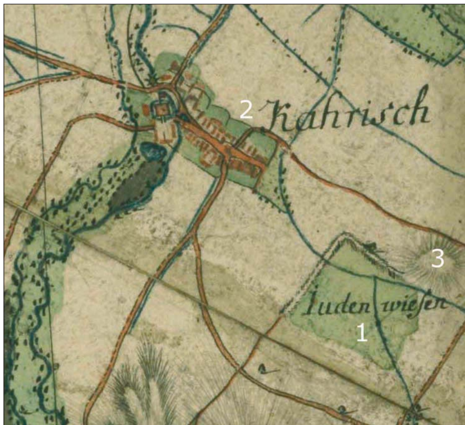
Ryc. 4. Prawdopodobna lokalizacja cmentarza pod Strzelinem: Juden wiesen (1), Karszówek (2), wzgórze Nadłęczce (3). Fragment mapy Ludwika Wilhelma Reglera z lat 1764–1770. Staatsbibliothek Berlin, Preußischer Kulturbesitz, sygn. 15140, nr 71