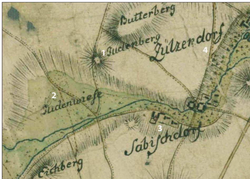
Ryc. 3. Lokalizacja cmentarza pod Świdnicą: Judenberg (1), Judenwiese (2), Zawiszów (3), Sulisławice (4). Fragment mapy Ludwika Wilhelma Reglera z lat 1764–1770. Staatsbibliothek Berlin, Preußischer Kulturbesitz, sygn. 15140, nr 58