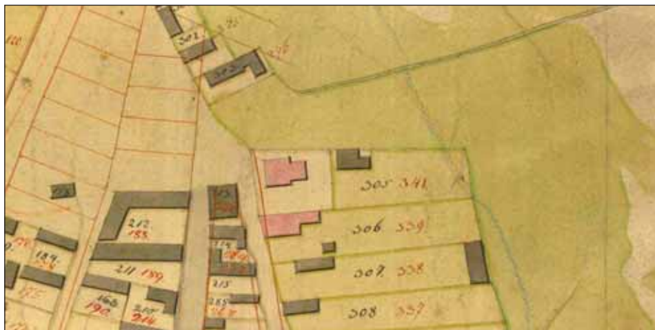
Ryc. 2. Fragment planu J. Bernharda z 1823 r. z posesją szpitala-przytułku św. Barbary (z niananiesionym) nr 304. Oryginał w Archiwum Państwowym w Łodzi, zesp. 609, sygn. 184