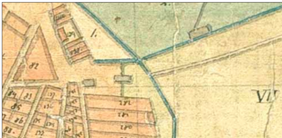
Ryc. 6. Fragment mapy F. Chądzyńskiego z 1819 r. z posesją szpitala-przytułku św. Barbary oraz rzeczką uchodzącą od północy do Warty. Oryginał w AGAD, zesp. 402, sygn. 340-27

Fig. 6. A fragment of F. Chądzyński's map from 1819, showing the plot of St Barbara's hospital poorhouse and a stream flowing into the Warta from the north. The original in AGAD (the Central Archives of Historical Records), set 402, catalogue no. 340-27