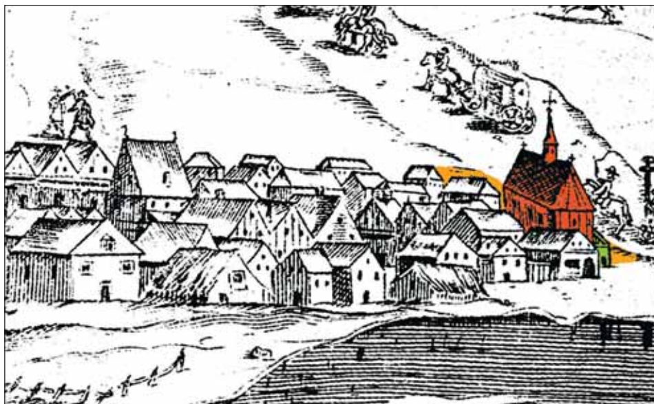
Ryc. 3. Szpital-przytułek św. Barbary (kolor zielony), kościół (kolor czerwony) oraz teren przykościelnego cmentarza (kolor pomarańczowy), oznaczone na fragmencie sztychu J.A. Gorczyzna z 1655 r. Oryginał w Muzeum Narodowym w Krakowie

Fig. 3. St Barbara's hospital-poorhouse (green), church (red) and cemetery (orange), marked in a fragment of J.A. Gorczyzna's etching from 1655. The original in the National Museum in Cracow