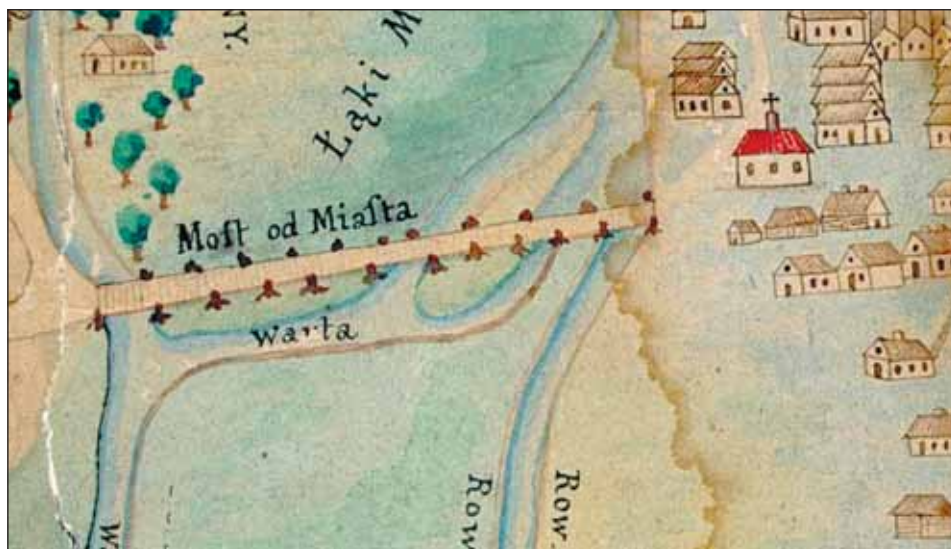
Ryc. 5. Fragment planu m. Częstochowy M. Germana z 1748 r. (wg wierzytelnej kopii S. Krajковского z 1889 r.), z przyszpitalnym kościołem św. Barbary oraz mostami na Warcie, widzianymi od północy. Oryginał w Archiwum klasztoru Jasna Góra, brak sygn.

Fig. 5. A fragment of M. German's street plan of Częstochowa from 1748 (after an authenticated copy made by S. Krajkowski in 1889), showing St Barbara's church and the bridges over the Warta (viewed from the north). The original in AJG (the Archive of the Jasna Góra Monastery), no catalogue no.