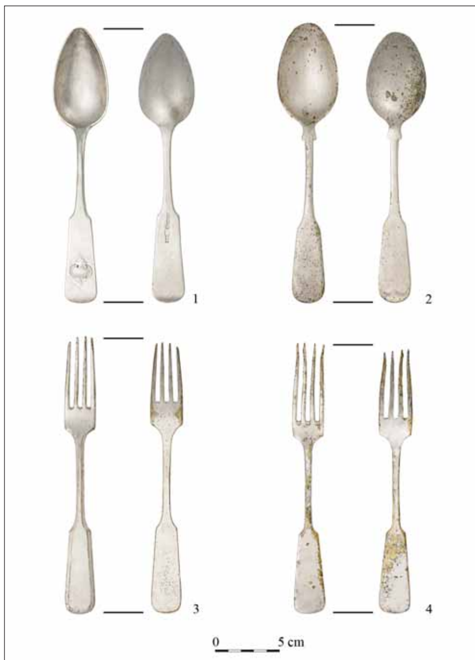
Ryc. 4. Sztućce z depozytu: 1 — łyżka srebrna z kartuszem; 2 — łyżka z alpaki; 3–4 — widelce z alpaki.