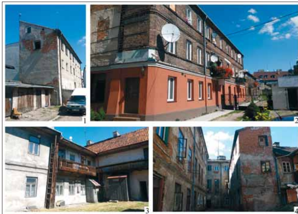
Ryc. 13. Płock — przykłady zachowanych oficyn na posesjach w obrębie dawnej dzielnicy żydowskiej, stan z 2017 r.: 1 — ul. Kwiatka 34; 2 — ul. Kwiatka 16; 3 — ul. Grodzka 5; 4 — ul. Synagogałna 5.