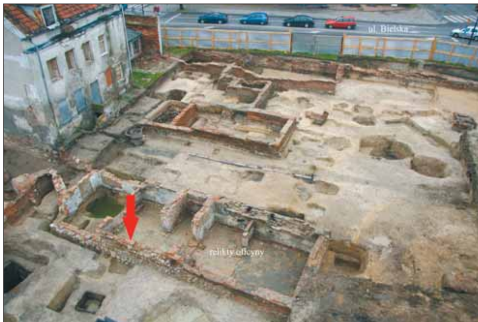
Ryc. 11. Płock — posesja przy ul. Kwiatka 40 (dawna Szeroka). Miejsce ukrycia depozytu w obrębie relikwów oficyny odsłoniętych podczas badań archeologicznych w 2009 r.