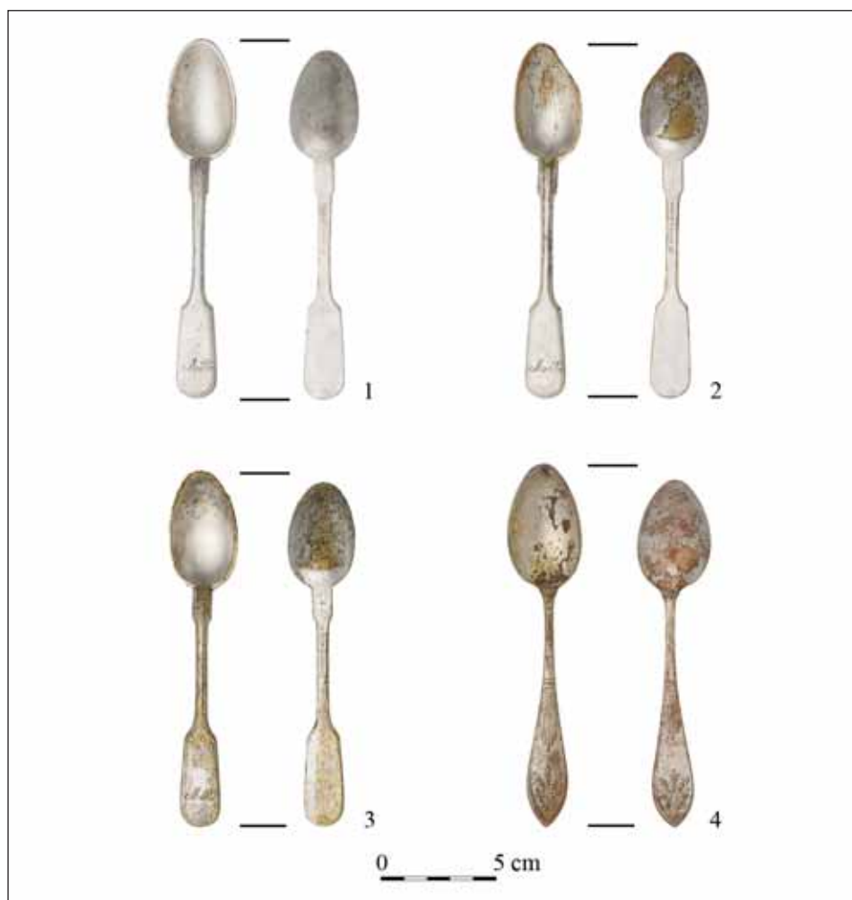
Ryc. 2. Łyżeczki z depozytu: 1–3 — łyżeczki z alpaki pochodzące prawdopodobnie z jednego kompletu; 4 — łyżeczka z platerowanego mosiądzu.