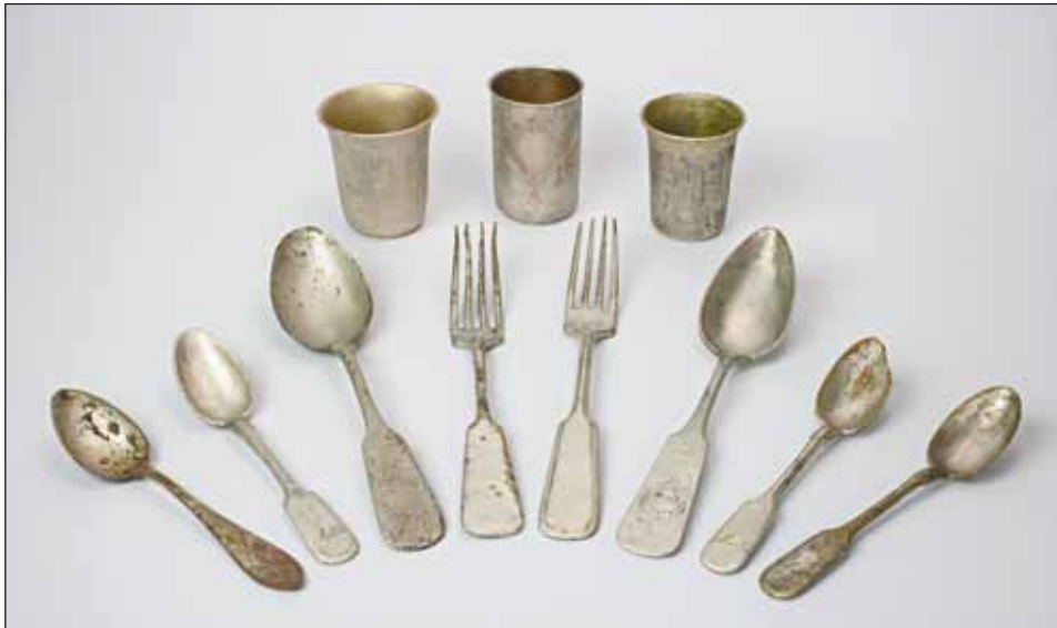
Ryc. 1. Przedmioty metalowe z ok. połowy XIX–początku XX w. tworzące depozyt znalezione podczas badań archeologicznych w Płocku, na posesji przy ul. Kwiatka 40 (dawna Szeroka).

Tytułowy depozyt tworzy jedenaście ukrytych wyrobów metalowych — sztućce oraz kubki, datowane w przybliżeniu na połowę XIX–początek XX w. 1 (ryc. 1). Wprawdzie nie stanowią one spektakularnego odkrycia, warto je jednak omówić z uwagi na tkwiący w nich spory potencjał informacyjny i rozmaite związane z tym kwestie, zwłaszcza społeczne, kulturowe i gospodarcze dotyczące Płocka w wiekach XIX i XX. Tworzące depozyt znaleziska to bowiem nie tylko pełnoprawne źródła materialne, ale też nośniki przekazów niewerbalnych. Celem artykułu jest charakterystyka poszczególnych egzemplarzy oraz próba wyjaśnienia, do kogo mogły one należeć, określenie ich znaczenia, a także okoliczności złożenia depozytu oraz czasu i miejsca jego znalezienia.