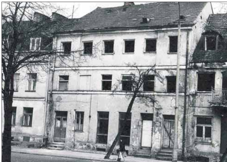
Ryc. 12. Płock — dom frontowy przy ul. Kwiatka 40 (dawna Szeroka), za którym znajdowała się oficyna, w której ukryto depozyt. Fotografia z 1988 r., z archiwum MWKZ Płock, za: D. Zaremba, op. cit., s. 125, ryc. 20