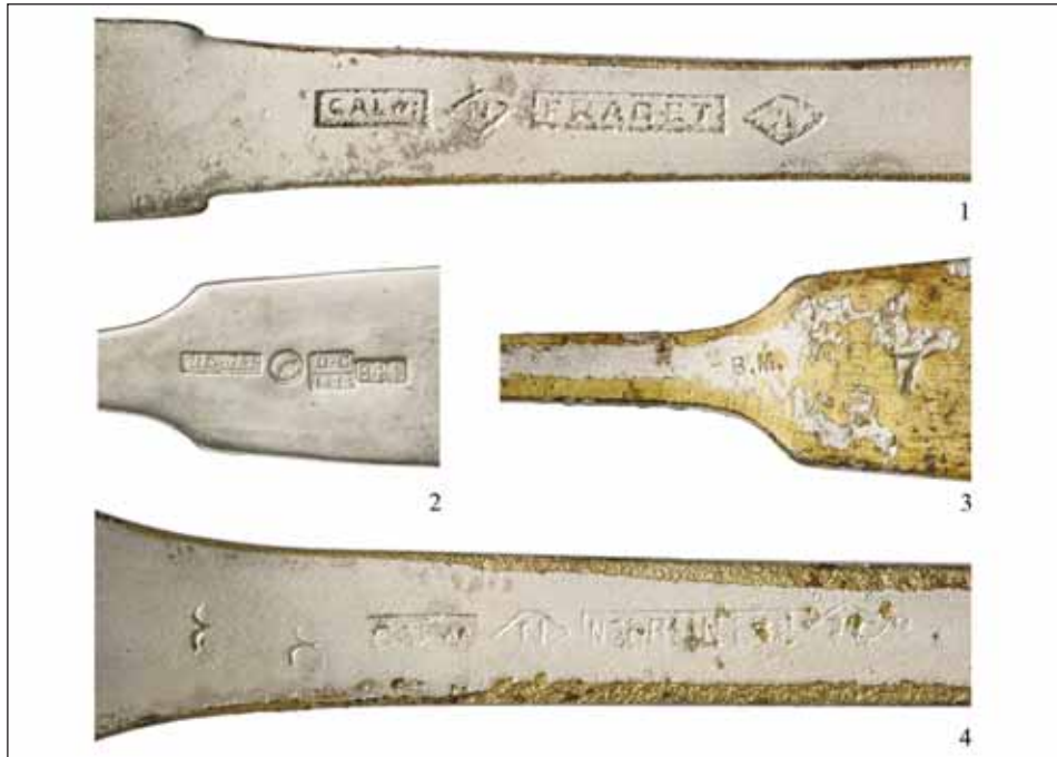
Ryc. 6. Znaki na sztućcach z depozytu: 1 — na trzech łyżeczkach z alpaki pochodzących prawdopodobnie z jednego kompletu; 2 — na łyżce ze srebra; 3–4 — na widelcach z alpaki. Fot. M. Osiadacz