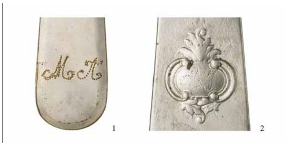
Ryc. 5. Monogramy grawerowane na łyżeczkach z alpaki pochodzących prawdopodobnie z jednego kompletu (1) i na łyżce ze srebra (2) z depozytu.