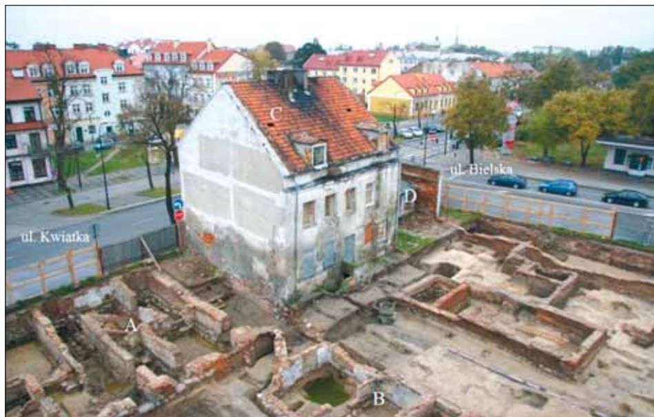
Ryc. 9. Płock — Przedmieście Bielskie, część południowa i zachodnia terenu badań archeologicznych, 2009 r., widok od północy: A — relikty domu frontowego przy ul. Kwiatka 40 (dawna Szeroka); B — relikty oficyny; C — dom frontowy przy ul. Kwiatka 42; D — oficyna przy ul. Kwiatka 44.