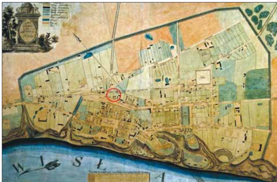
Ryc. 10. Płock, plan miasta z 1823 r. tzw. Mahna, z lokalizacją badanej części Przedmieścia Bielskiego, za: Płock wczesnośredniowieczny , red. A. Gołembnik, Origines Polonorum , t. 4, Warszawa 2011, il. 5