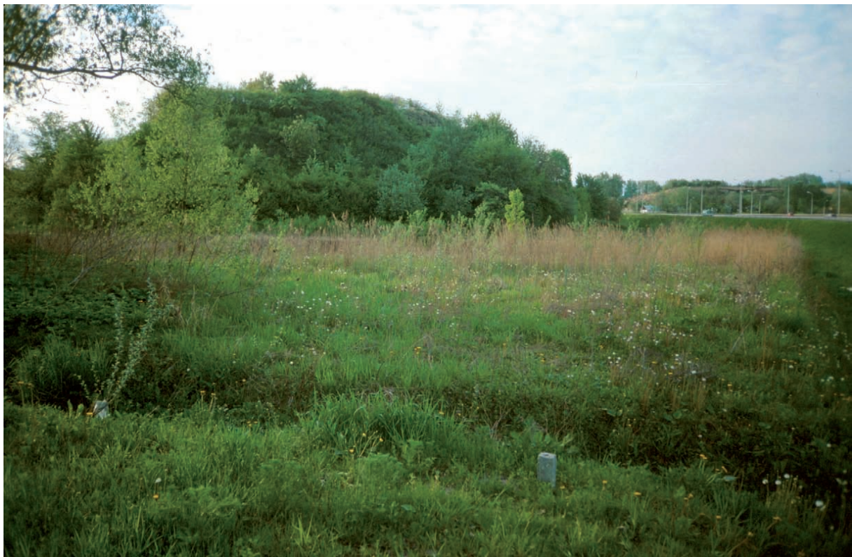
Ryc. 7. Sandomierski Żmigród: widok od strony krawędzi zachodniej Fig. 7. Żmigród in Sandomierz: a view from the side of the western slope