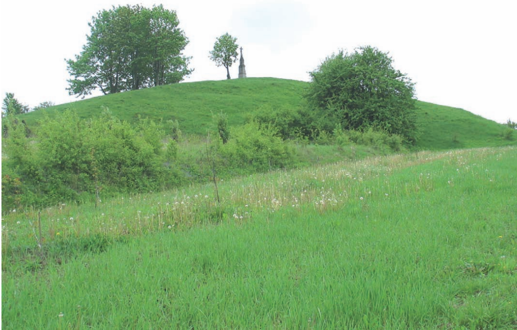
Ryc. 6. Sandomierz, Wzgórze Salve Regina, widok od północy Fig. 6. Sandomierz, Wzgórze Salve Regina (Salve Regina Hill), a view from the North