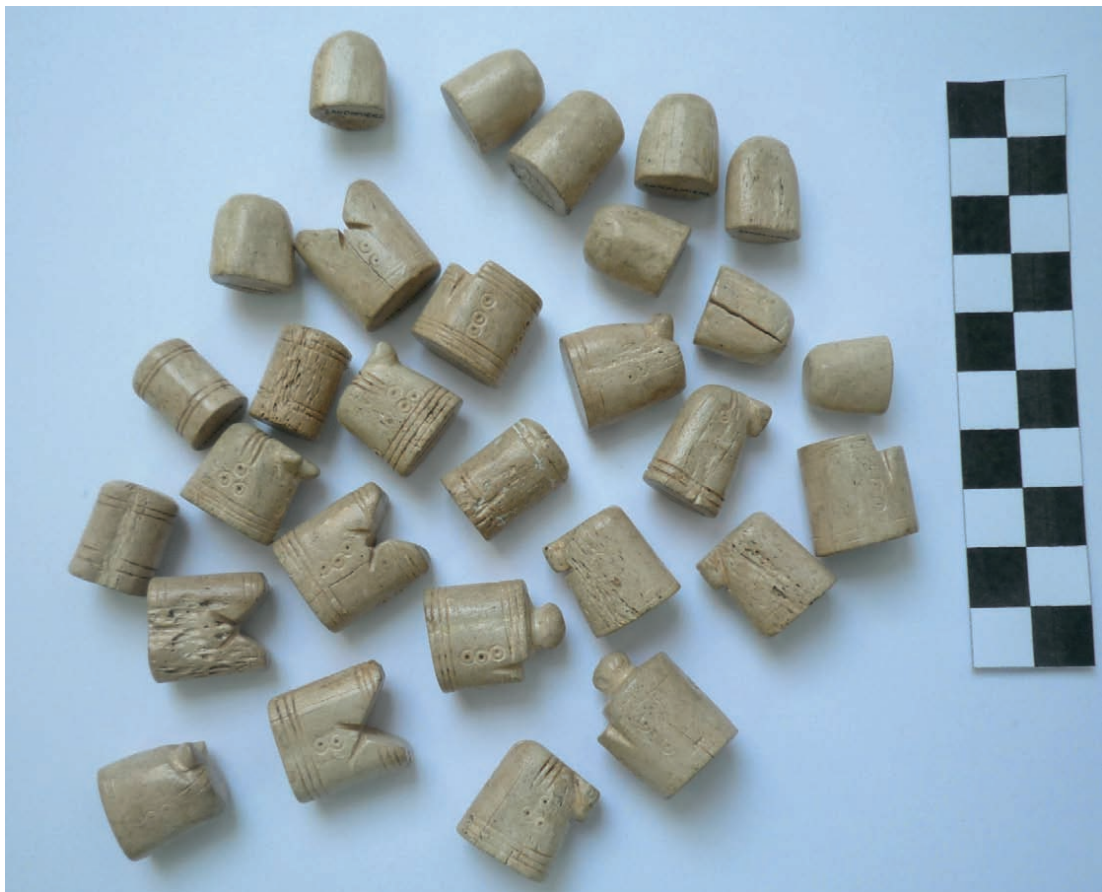
Ryc. 5. Sandomierz, Wzgórze Świętojakubskie, szachy z rogu jelenia

Fig. 4. A view on the St. James's Church from the western side, exactly from the place where the part of the St. James's settlement with the so-called hut with chess was located. The area is also the presumed location of the St. John's Church