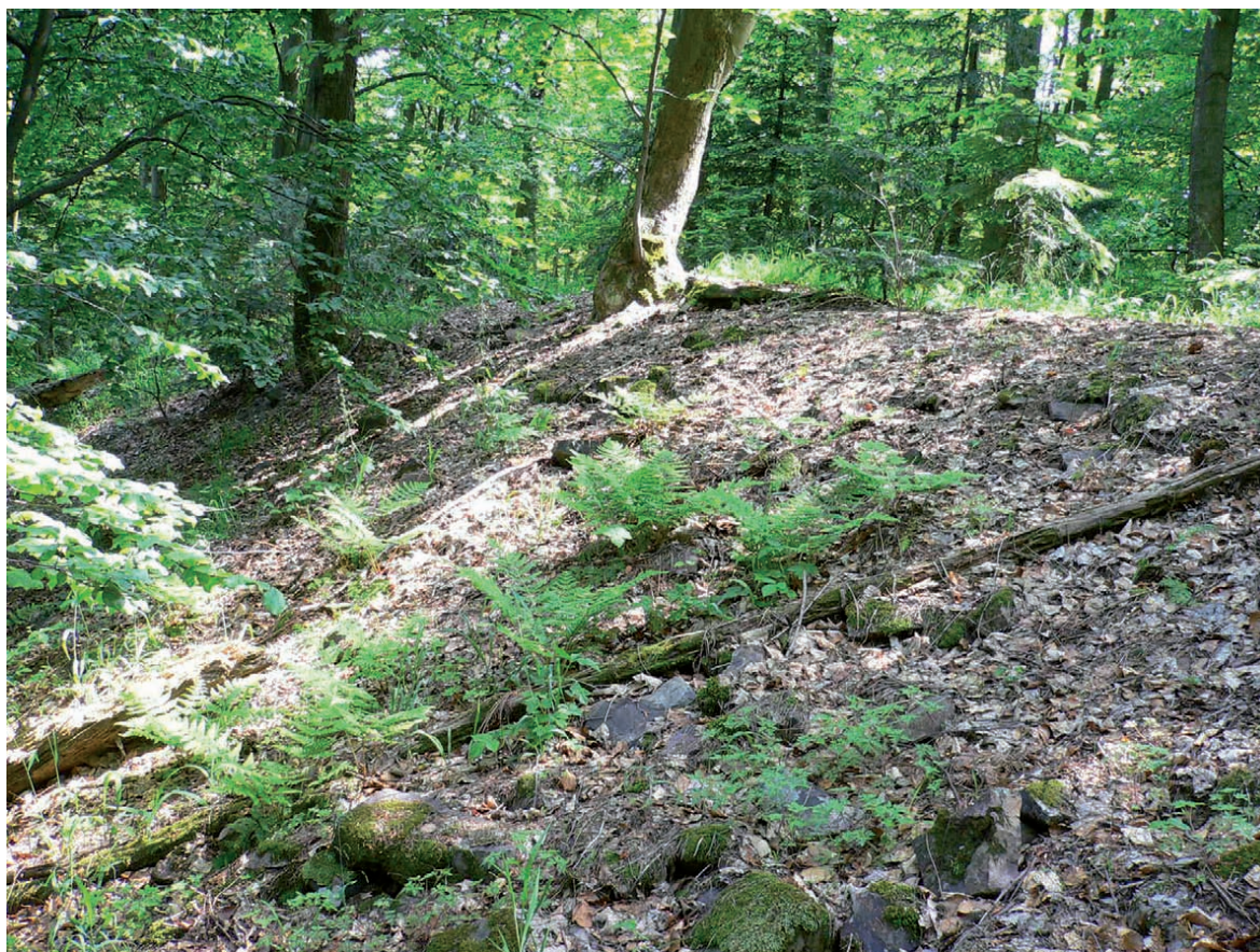
Ryc. 8. Szczyt Łyśca w Górach Świętokrzyskich: fragment wału kamiennego po stronie północnej Fig. 8. The top of Łysiec in the Holy Cross Mountains: a fragment of the stone rampart on the northern side

Archeologii Słowiańskiej UW i Instytutu Historii Kultury Materialnej PAN. Pracami w terenie kierował wówczas J. Gąssowski, a ogólne kierownictwo badań sprawował Witold Hensel. W kolejnym 1960 r. badaniami objęto, oprócz wspomnianego wału, osadę w Łazach, traktowaną jako pozostającą w związku istniejącymi w tym rejonie stanowiskami hutniczymi. W roku 1961 przeprowadzono wykopaliska na Bielniku i dokończono program badań na osadzie w Łazach. Program 5-letnich prac terenowych ukończono w roku 1962, koncentrując się wówczas na klasztorze i jego otoczeniu. Poszukiwano głównie romańskich i gotyckich świadectw klasztoru.