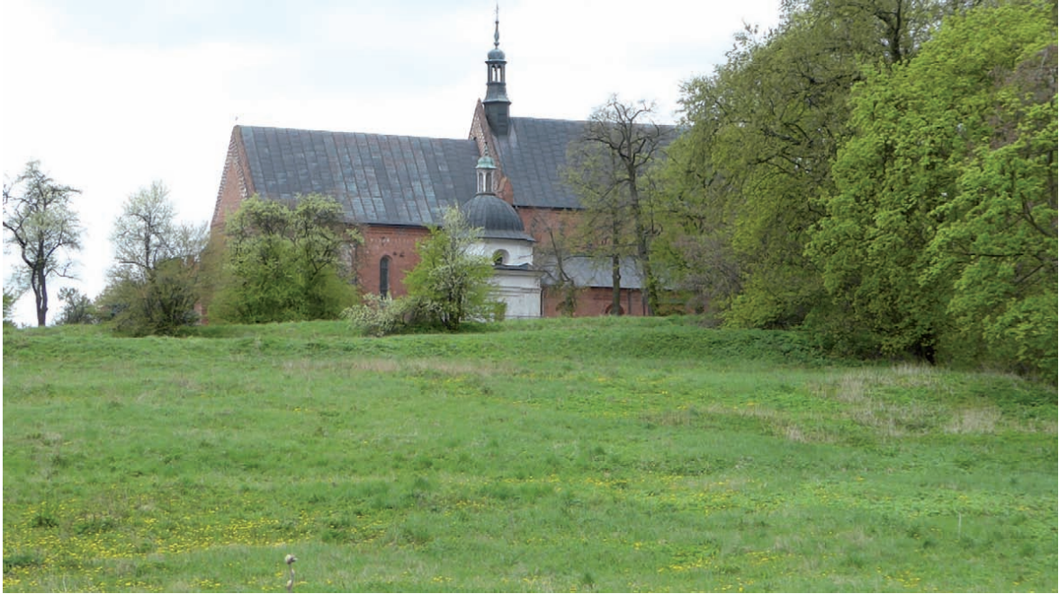
Ryc. 4. Widok od strony zachodniej na kościół św. Jakuba z miejsca, gdzie znajdowała się część osady świętojakubskiej z tzw. chatą z szachami. Pole to, to zarazem domniemana strefa lokalizacji kościoła św. Jana

Fig. 4. A view on the St. James's Church from the western side, exactly from the place where the part of the St. James's settlement with the so-called hut with chess was located. The area is also the presumed location of the St. John's Church