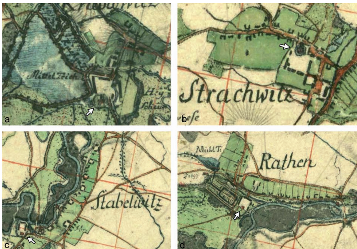
Ryc. 3. Plany wsi z lokalizacją obiektów obronno-rezydencjonalnych wg XVIII-wiecznych map L.W. Reglera: a) Krobielowice; b) Strachowice; c) Stabelowice; d) Ratyń (Staatsbibliothek Berlin, Preußischer Kulturbesitz, sygn. N 15140)