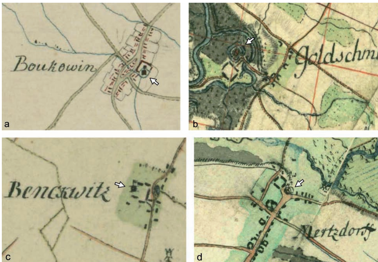
Ryc. 1. Plany wsi z lokalizacją obiektów obronno-rezydencjonalnych wg XVIII-wiecznych map Ch.F. Wredego (a) i L.W. Reglera (b-d): a) Bukowina; b) Złotniki; c) Bieńkowiec; d) Marcinkowice (Staatsbibliothek Berlin, Preußischer Kulturbesitz, sygn. N 1506, N 15140)