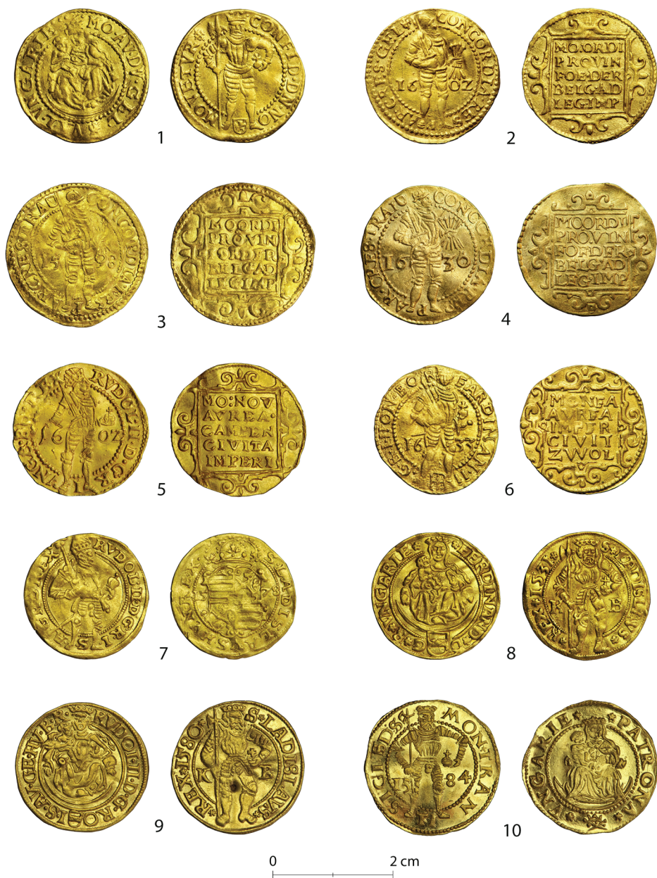
Ryc. 3. Głębinów, monety nr 1–10 ze skarbu